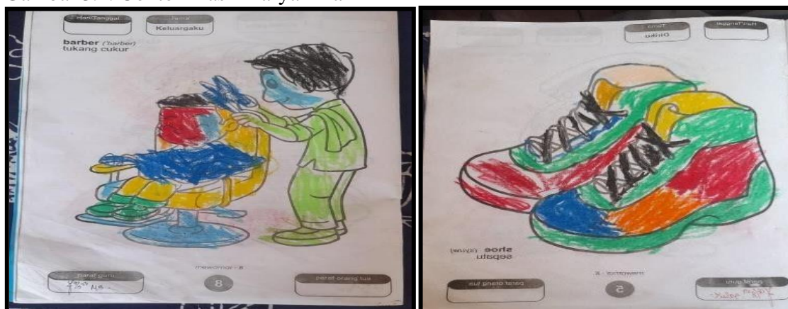
Gambar 3.2. Contoh Hasil Karya Anak

Penerapan Teknik penilaian hasil karya tidak hanya digunakan dalam menilai aspek perkembangan seni anak, akan tetapi perkembangan motorik halus juga bisa dinilai. Pada hasil karya anak dapat dipanjangkan dalam bentuk mandiri atau dibuat pemeran karya anak yang disajikan secara bersama. Biasanya penilaian pada hasil karya hanya berupa komentar guru tentang karya yang sudah dibuat oleh anak, seperti 'sudah bagus' masih kurang, dilengkapi lagi ya', 'kurang bagus', 'kurang rapi'