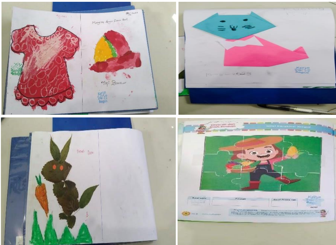
Gambar 3.1 Contoh Portopolio