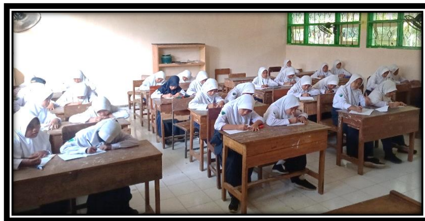
Gambar 3. Kegiatan Pendampingan

Adapun rincian kegiatan dalam pengabdian kepada Masyarakat sebagai berikut :