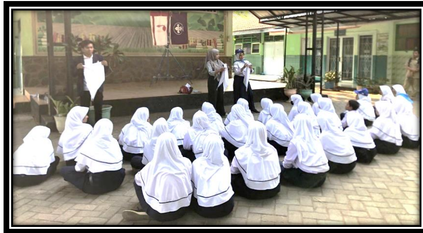
Gambar 2. Kegiatan pelatihan

mengkonfirmasi kehadiran. Tim pengabdian juga mulai mempersiapkan perlengkapan pelatihan dan pendampingan yakni materi, tempat, dan administrasi.