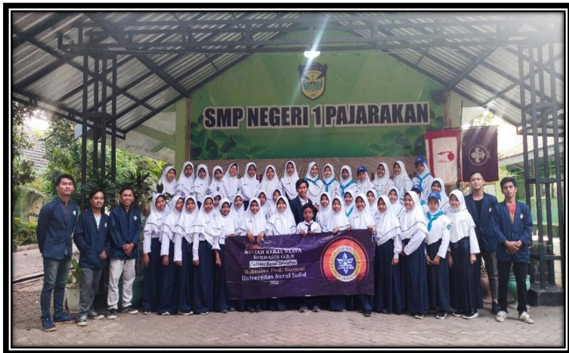
Gambar 4. Tim Pengabdian dan Peserta Pelatihan

Pelatihan pertolongan pertama pada siswa menengah dapat meningkatkan pengetahuan mereka tentang prosedur pertolongan pertama dan rasional dari Tindakan yang dilakukan. Pertolongan pertama merupakan Tindakan yang sangat penting dan harus dipaami karena dapat mencegah cedera yang lebih serius, kecatatan bahkan kematian korban. Menurut Muneswari pelatihan memainkan peran penting dalam meningkatkan pengetahuan pertolongan pertama pada siswa sekolah menengah. Memberikan pengetahuan dan keterampilan pertama akan meningkatkan peran mereka dan menjadi agen perubahan dalam penanganan kegawatan di lingkungan keluarga dan Masyarakat (Juhdeliena, Siswadi, Panjaitan, Cicilia, & Hutasoit, 2020). Selain itu kegiatan simulasi penanganan kegawatan memberikan pengalaman dan Praktek yang baik untuk dapat diterapkan Ketika menghadapi situasi kegawatan yang sebenarnya (Yuda & Suwaryo, 2020)