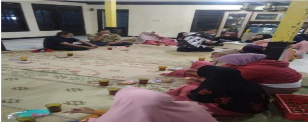
Gambar 2 Penyuluhan UMKM Gita Laras Kalisoro Tawangmangu 24 Nop. 2022

Gambar 1 dan Gambar 2 menunjukkan kegiatan penyuluhan yang dilakukan oleh tim pengabdian. Kegiatan berjalan lancar diikuti 25 peserta dari kalangan perempuan yang tergabung dalam UMKM Gita Laras Kalisoro Tawangmangu. Beberapa kesepakatan telah tercapai antara lain :