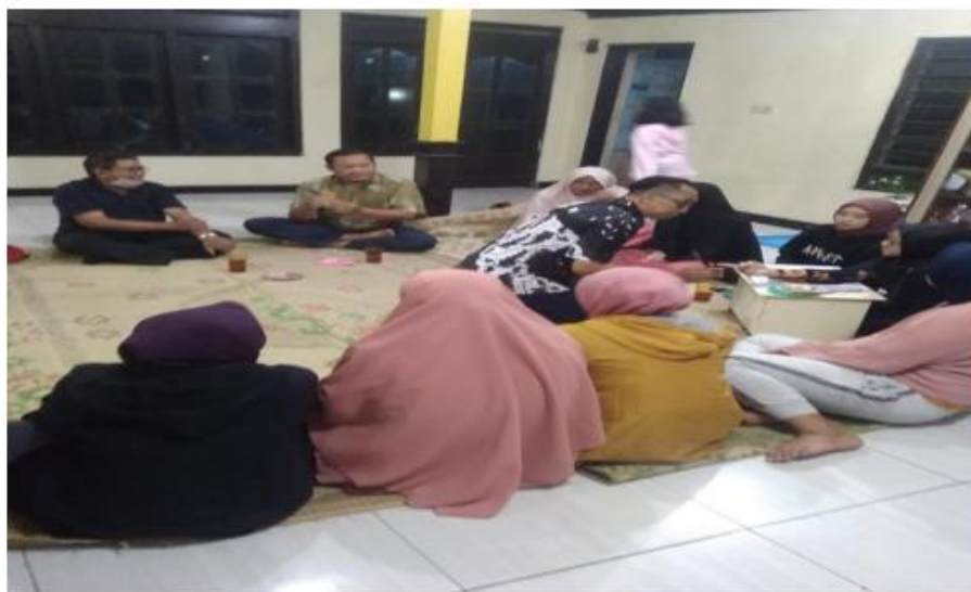
Gambar 1 Penyuluhan UMKM Gita Laras Kalisoro Tawangmangu 24 Nop. 2022