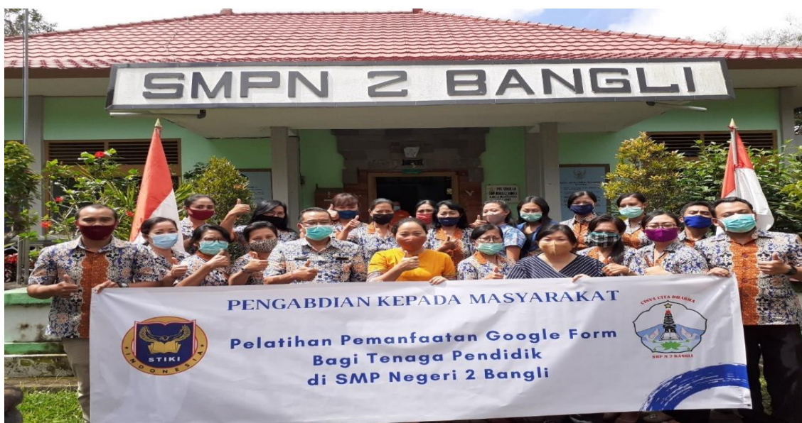
Gambar.4. Sesi Foto Bersama

Gambar 3 adalah penyampaian materi oleh Ibu Welda pada hari kedua. Dapat dilihat pada gambar materi pelatihan membahas bagaimana caranya membuat soal menggunakan jenis soal pilihan ganda. Dan ada beberapa guru yang mencoba menjawab soal yang diberikan menggunakan handphone .