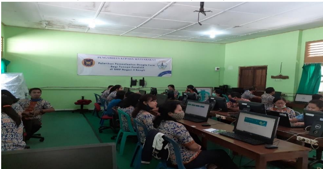
Gambar 2. Peserta Pelatihan

Gambar 1 diatas merupakan gambar materi yang disajikan pada pelatihan tersebut, dimana pada awal materi terdapat penyampaian materi Google Classroom sedikit dan setelah itu masuk ke dalam materi Google Form . Teknis pelatihannya adalah, pembicara yaitu Ibu Ayu Manik dan Ibu Welda menyampaikan materi terlebih dahulu setelah materi selesai, pembicara akan langsung mempraktekkan yang diikuti oleh peserta pelatihan.