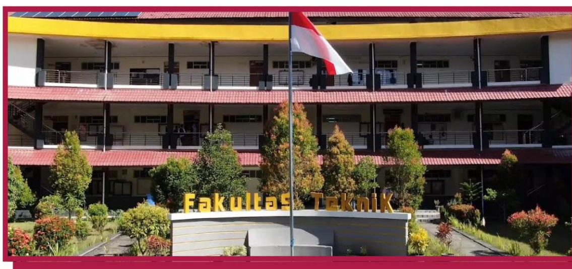
Gambar 1. Gedung Fakultas Teknik, Universitas Halu Oleo, lokasi pelaksanaan kegiatan

komponen alat, maupun kecelakaan kerja, sebagaimana umum terjadi pada laboratorium yang minim acuan operasional tertulis (Syakbania & Wahyuningsih, 2017). Keterbatasan jumlah laboran dibandingkan jumlah mahasiswa turut memperlambat proses pembelajaran, sebab satu laboran harus menjelaskan prosedur yang sama berulang kali kepada kelompok praktikum yang berbeda, yang pada akhirnya menurunkan efisiensi waktu dan kualitas pengalaman belajar mahasiswa. Ketergantungan pada komunikasi verbal inilah yang menjadi titik tolak kegiatan pengabdian ini, yaitu menggeser pola pelayanan informasi prosedural dari yang semula bersifat lisan dan situasional menuju bentuk digital yang terdokumentasi dan dapat diakses kapan saja oleh penggunanya.