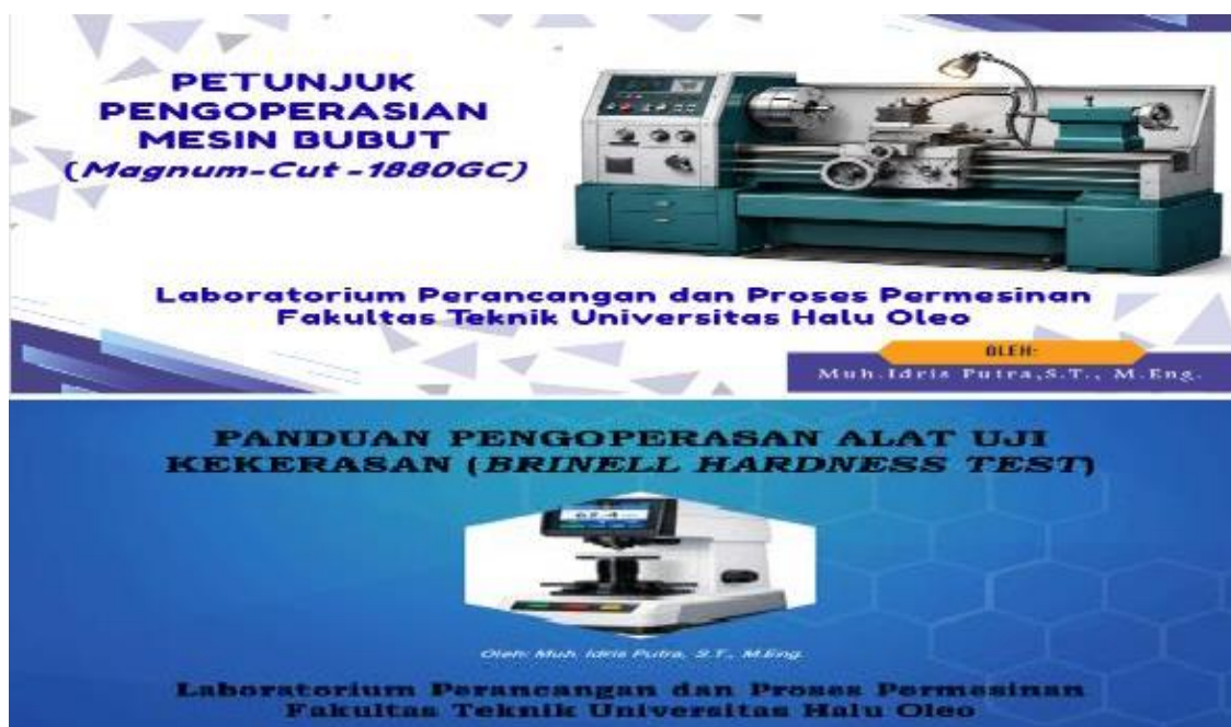
Gambar 4. Contoh cover panduan digital pengoperasian mesin bubut dan uji kekerasan material

Capaian akhir kegiatan, termasuk dokumentasi label QR-Code yang telah terpasang pada peralatan dan respons mahasiswa pada sesi evaluasi, ditunjukkan pada Gambar 4. Tabel 1 selanjutnya menyajikan gambaran ringkas mengenai tiga aspek utama yang berubah setelah panduan digital ini diterapkan.