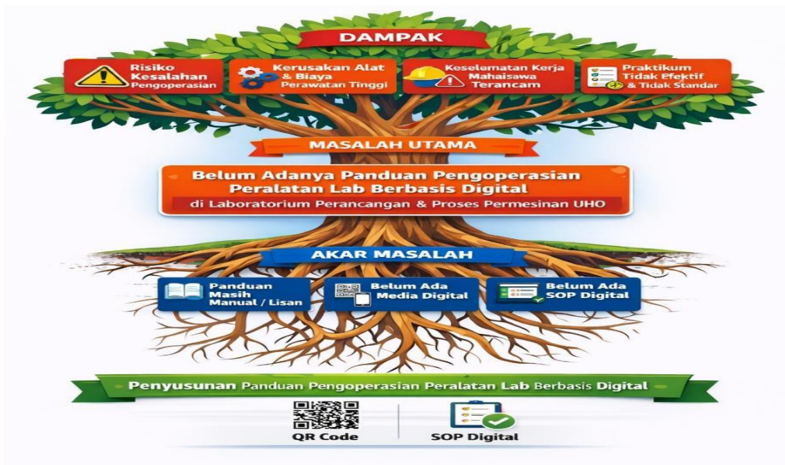
Gambar 2. Analisis pohon masalah (problem tree) yang melandasi perumusan kegiatan

diterapkan pada laboratorium praktikum karena mahasiswa memerlukan informasi teknis tepat saat berada di depan alat yang akan dioperasikan.