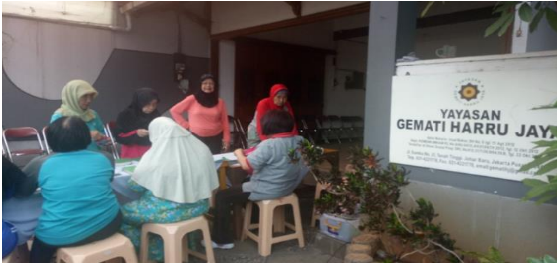
Kegiatan di Yayasan GHY