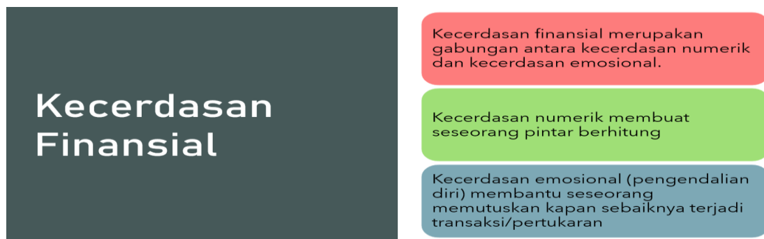
Gambar 6. Kecerdasan Finansial

Selanjutnya siswa akan mempelajari mengenai jenis-jenis pengeluaran dan kecerdasan finansial. Tampilan materi dapat dilihat pada gambar 5 dan 6. Materi ini bertujuan supaya siswa bisa lebih bijaksana dalam mengalokasikan uangnya pada sesuatu yang benar-benar mereka butuhkan bukan hanya memenuhi keinginan semata. Dampak yang diharapkan adalah siswa mempunyai gambaran mengenai kecerdasan finansial.