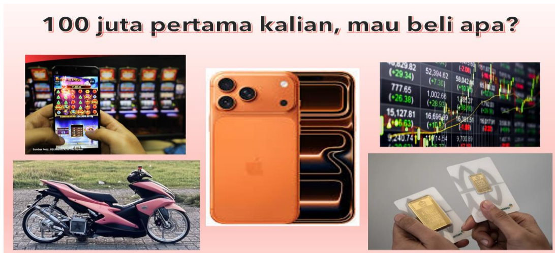
Gambar 1. Pertanyaan Pembuka Untuk Peserta

pengelolaan keuangan personal. Materi mencakup konsep dasar keuangan, pengelolaan keuangan, level finansial, jenis-jenis pengeluaran, dan kecerdasan finansial. Penyajian materi dirancang interaktif melalui kombinasi penjelasan, contoh kasus, visualisasi data, dan ilustrasi penggunaan uang dalam konteks kehidupan remaja supaya lebih mudah dipahami. Materi yang sudah dibuat, kemudian dipresentasikan menggunakan power point, dan dapat dilihat pada gambar berikut ini.