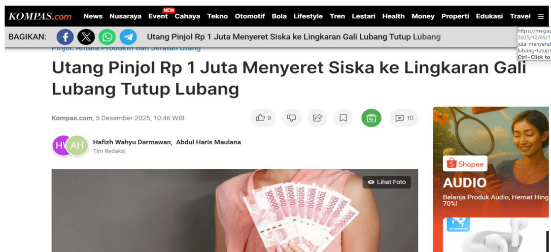
Gambar 4. Studi Kasus Pengelolaan Keuangan Yang Buruk

Tim pengabdian juga menyampaikan berbagai kasus mengenai pengelolaan keuangan supaya siswa lebih mudah memahami dan mempunyai gambaran nyata mengenai pengelolaan keuangan. Dengan metode bedah kasus, siswa diajak untuk mampu menganalisis penyebab masalah dan mampu memberikan alternatif solusi. Pendekatan ini mendorong siswa/siswi untuk berpikir kritis serta mengaitkan konsep literasi keuangan dengan situasi yang dekat dengan kehidupan sehari-hari, seperti pengelolaan uang saku, kebiasaan konsumsi, dan pengambilan keputusan finansial