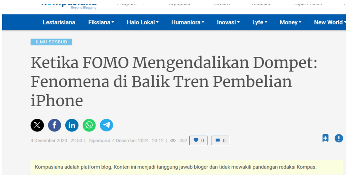
Gambar 3. Studi Kasus Fenomena Keuangan

Setelah siswa mampu mengidentifikasi kebiasaan keuangan mereka, selanjutnya tim pengabdian juga akan memberi penjelasan mengenai level finansial. Siswa diminta memahami makna berbagai level keuangan beserta contoh kebiasaan keuangan di setiap level. Kemudian siswa diajak untuk berpikir, berada di level keuangan yang manakah mereka.