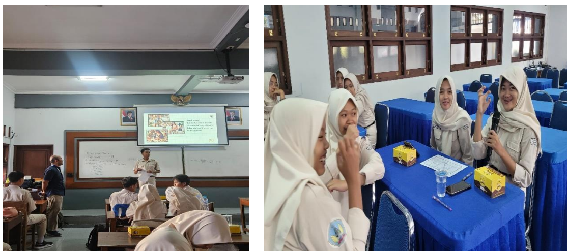
Gambar 8. Refleksi oleh Siswa

pengeluaran mendesak dan tidak mendesak serta membangun kebiasaan keuangan yang sehat, menghindari gaya hidup konsumtif.