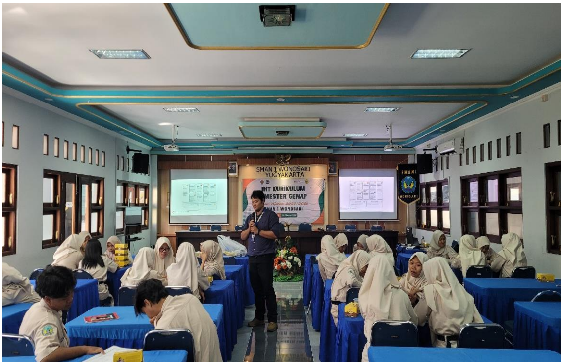
Gambar 7. Pemaparan Materi oleh Tim

pinjaman atau metode pembiayaan jangka pendek seperti Paylater , sehingga sulit untuk memiliki cadangan dana darurat. Level Stagnan menggambarkan individu yang terjebak dalam pola konsumsi berlebihan dan gaya hidup mewah, meskipun pendapatan meningkat, tetapi tidak memperhatikan pentingnya tabungan atau investasi masa depan. Pada level Stabil, seorang individu telah mencapai kestabilan keuangan, tidak lagi terpengaruh oleh tekanan sosial atau gaya hidup konsumtif. Level paling tinggi merupakan kebebasan finansial, di mana seorang individu sudah memiliki pendapatan pasif dari investasi, aset, atau bisnis seseorang melebihi pengeluaran hidup, sehingga dapat terus menjalani kehidupan tanpa harus bekerja untuk mencari uang (Zhu, 2024). Materi terkait empat level finansial ini sangat penting untuk diberikan kepada siswa-siswi Kelas XI supaya dapat membantu siswa/siswi dalam menentukan tujuan keuangan jangka panjang, meningkatkan kesadaran akan pengelolaan keuangan yang bijak, serta memperkuat keterampilan mereka dalam membuat keputusan finansial yang positif.