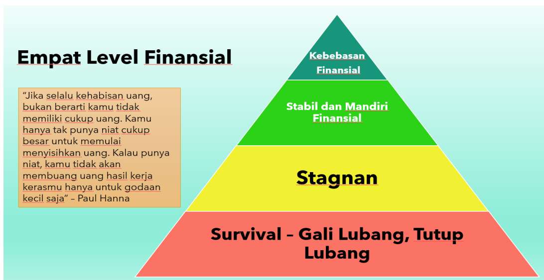
Gambar 2. Level Finansial

Gambar 1 menunjukkan barang atau kegiatan yang bisa dipilih siswa apabila memiliki uang seratus juta rupiah. Pertanyaan ini bertujuan untuk memancing interaksi dengan siswa. Selanjutnya siswa akan diminta untuk berefleksi apakah pengeluaran mereka yang sudah terjadi mengarah pada konsumsi atau investasi. Metode ini akan mendorong siswa untuk mengidentifikasi kebiasaan keuangan mereka.