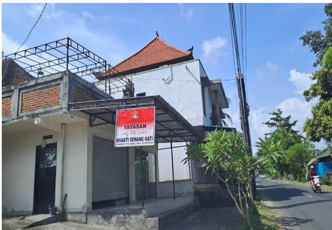
Gambar 1. Lokasi Yayasan Bhakti Senang Hati

Berdasarkan permasalahan yang dihadapi Yayasan Bhakti Senang Hati, maka Dosen INSTIKI mengambil inisiatif dalam melakukan pengabdian kepada masyarakat untuk memberikan bantuan/ sumbangan berupa kebutuhan bahan pokok. Sebagai bentuk adanya mitra kerjasama antara INSTIKI dengan Yayasan Bhakti Senang Hati maka dilakukan penandatanganan surat pernyataan agar proses kegiatan ini berjalan dengan baik. Adapun dokumentasi kegiatan pada tahapan persiapan adalah sebagai berikut: