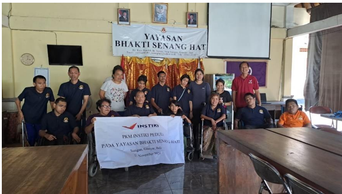
Gambar 8. Foto Bersama

Pada Gambar 7, ditampilkan dokumentasi saat anggota Yayasan melakukan absensi kehadiran Kegiatan.