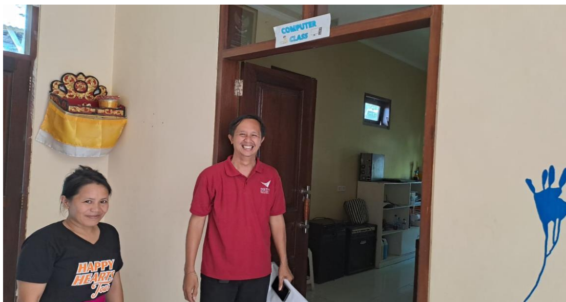
Gambar 2. Wawancara dan Observasi Lokasi Yayasan Bhakti Senang Hati

Pada Gambar 2, merupakan dokumentasi setelah kegiatan wawancara dengan salah satu pengurus Yayasan Bhakti Senang Hati.