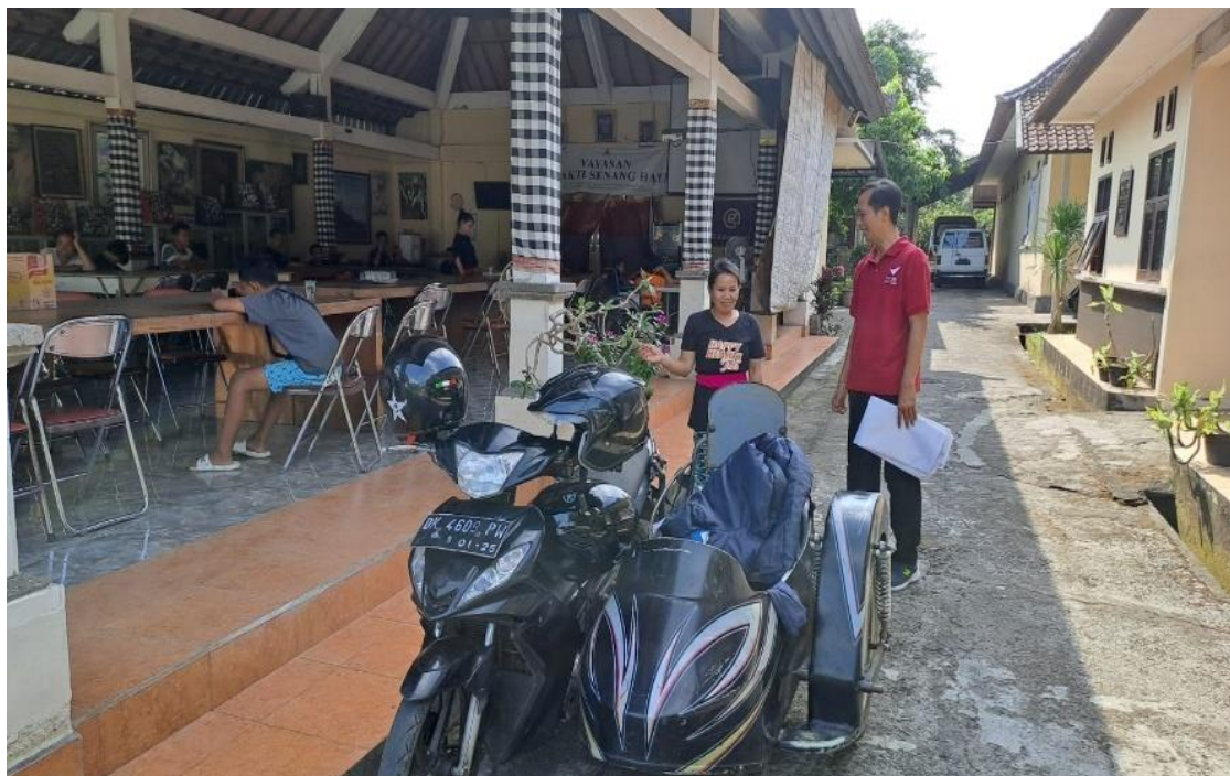
Gambar 6. Penyampaian Pesan dan Harapan

Pada Gambar 5, ditampilkan dokumentasi saat anggota Yayasan memberikan testimoni setelah kegiatan berlangsung.