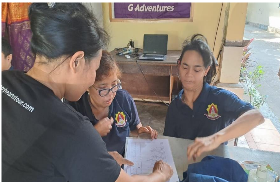
Gambar 7. Absensi

Pada Gambar 6, ditampilkan dokumentasi saat salah satu dari Pengurus Yayasan menyampaikan pesan dan harapan dari kegiatan Pengabdian Kepada Masyarakat.