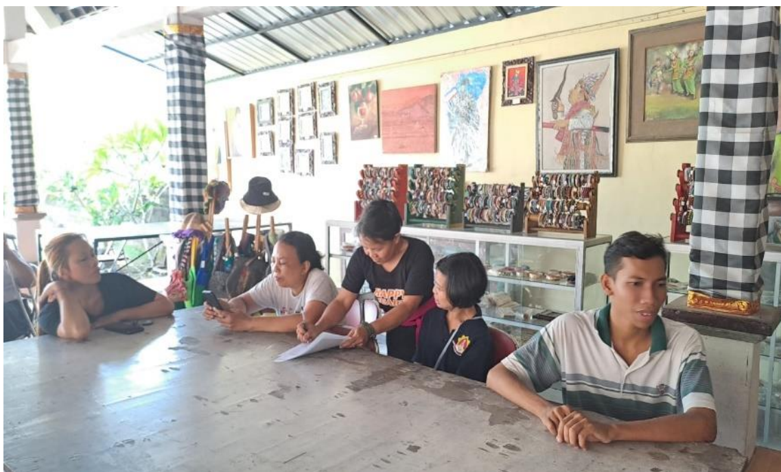
Gambar 5. Testimoni dari Anggota Yayasan

Pada Gambar 4, ditampilkan dokumentasi saat Ketua Pengabdian Kepada Masyarakat memberikan sambutan pada kegiatan dan dilanjutkan dengan penyerahan bantuan/sumbangan bahan pokok makanan.