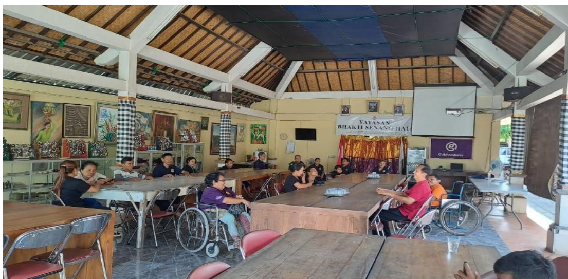
Gambar 3. Sambutan Dari Pihak Yayasan

Adapun pelaksanaan Kegiatan Pengabdian Kepada Masyarakat di Yayasan Bhakti Senang Hati, adalah sebagai berikut: