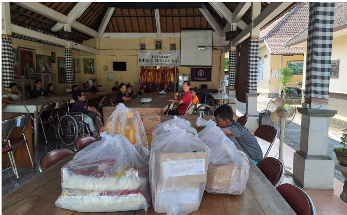
Gambar 4. Sambutan Dari Ketua PKM dan Penyerahan Bantuan/ Sumbangan

Pada Gambar 3, ditampilkan dokumentasi saat Ketua Yayasan memberikan sambutan pada kegiatan Pengabdian Kepada Masyarakat