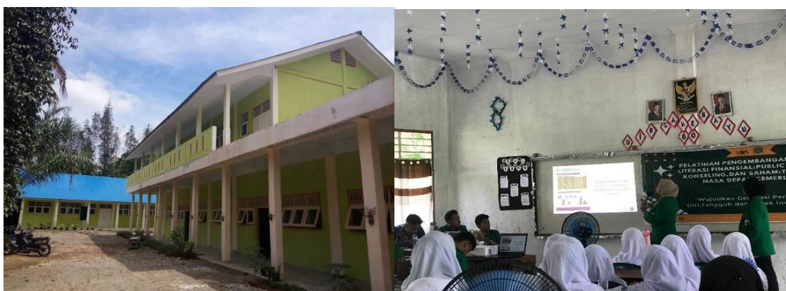
Gambar 1. Gedung dan Dokumentasi Kegiatan Edukasi Investasi Di Kelas SMK Tunas Harapan

Metode pembelajaran mencakup ceramah interaktif, demonstrasi aplikasi investasi, simulasi pengelolaan uang saku dengan prinsip 50–30–20, serta diskusi kelompok. Data dikumpulkan melalui kuesioner pre-test dan post-test, observasi partisipasi siswa, serta dokumentasi kegiatan.