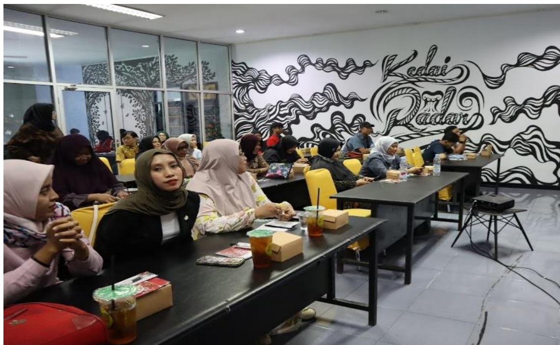
Gambar 1 Penerimaan Materi Sosialisasi

Melalui implementasi program edukasi dan sosialisasi ini diharapkan para peserta dapat menerapkan tentang prinsip-prinsip dasar untuk menerapkan efektivitas pribadi dan professional terhadap kegiatan usaha yang dijalani serta menekankan perubahan karakter para pelaku UMKM.