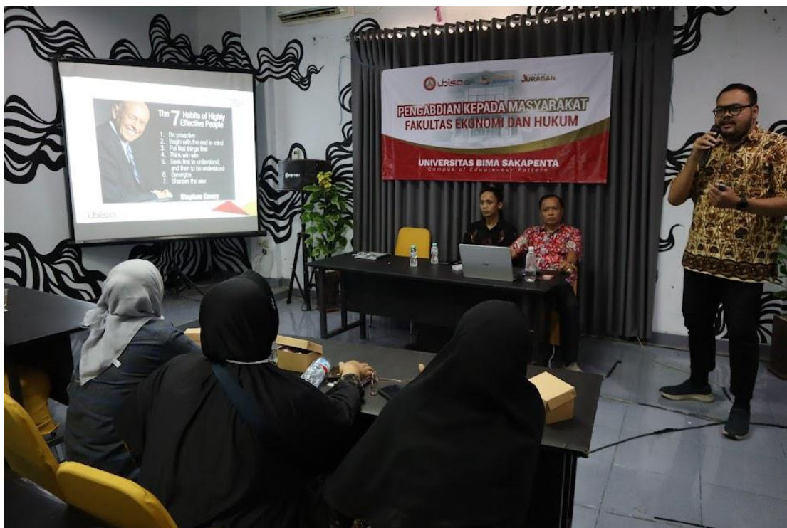
Gambar 2 Penyampaian Materi Sosialisasi oleh Pemateri

Dalam pelaksanaan sosialisasi edukasi kepada pelaku usaha/UMKM, Peserta menunjukkan peningkatan pemahaman dimana para peserta lebih mengenal kebiasaan-kebiasaan yang dapat meningkatkan efektivitas dalam melakukan aktivitas usaha. Pada sesi diskusi para peserta memberikan pendapat terkait hal apa saja yang harus diutamakan dalam meningkatkan efektivitas serta saran dalam memulai untuk menerapkan konsep 7 Habits of Highly Effective People pada kegiatan usaha.