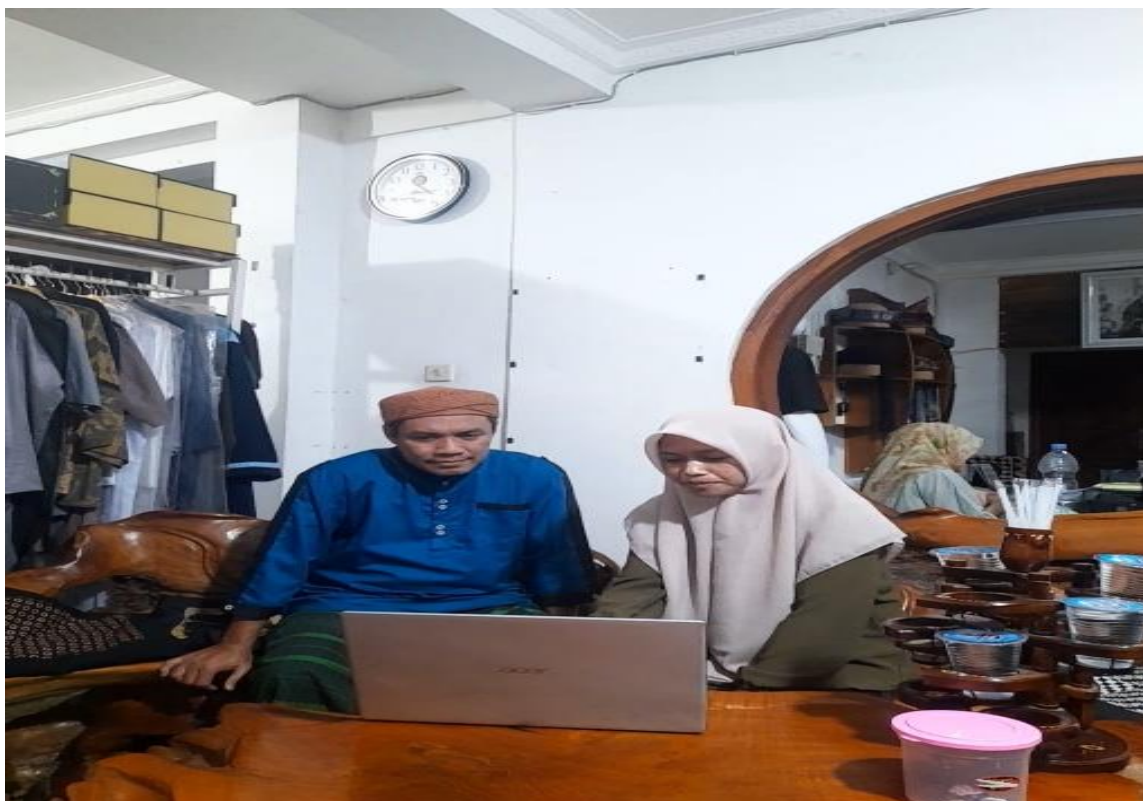
Gambar 2. Pendampingan Pelaku UMKM Peci Batik Jogokariyan

Pelaksanaan kegiatan pada UMKM Peci Batik menghasilkan beberapa temuan terkait sistem pencatatan stok yang digunakan. Pada tahap observasi, penulis melakukan kunjungan langsung dan berdiskusi dengan pemilik untuk memahami alur barang masuk dan keluar. Dari tahap ini diketahui bahwa pencatatan barang keluar sudah dilakukan di Excel, namun barang masuk belum dicatat sama sekali. Kondisi tersebut membuat pemilik sering kebingungan mengetahui jumlah stok sebenarnya karena tidak ada data lengkap yang menunjukkan pergerakan persediaan.