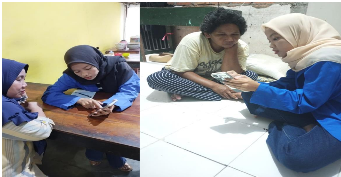
Gambar 1. Pelatihan Dan Pendampingan Penggunaan Teman Bisnis

Hasil observasi awal menunjukkan bahwa pelaku UMKM Penyetan Selera Pedas dan Molen Bu Yati belum memiliki sistem pencatatan keuangan yang teratur. Pencatatan transaksi dilakukan secara tidak konsisten, sebagian besar masih mengandalkan ingatan, serta belum terdapat pemisahan yang jelas antara keuangan usaha dan keuangan pribadi. Kondisi ini menyebabkan pelaku UMKM kesulitan dalam mengetahui besaran pemasukan, pengeluaran, serta laba usaha secara akurat.