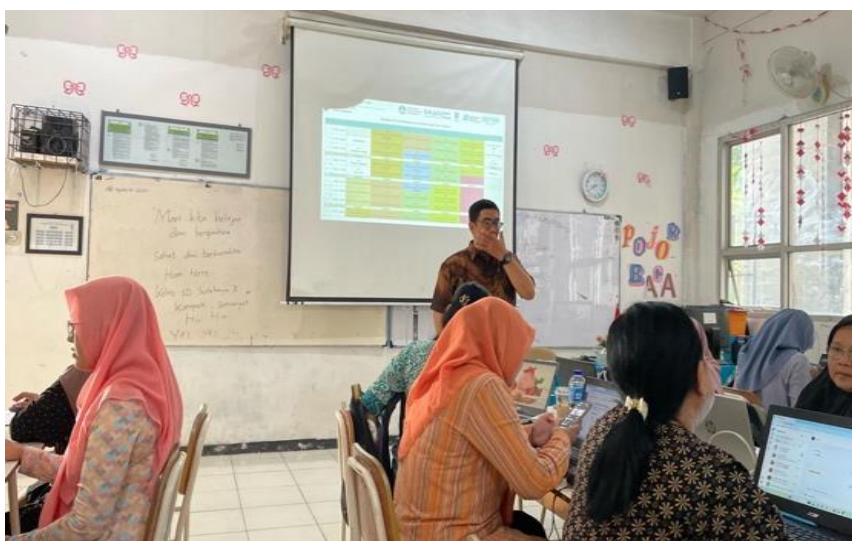
Gambar 1. Proses Diskusi dan Pendampingan dalam Penyusunan Kisi-Kisi Soal

Paparan materi di atas disertai dengan praktik langsung oleh guru-guru dalam merancang draft soal sesuai dengan mata pelajaran dan kelas yang diampu, yang dipandu langsung oleh tim PkM.