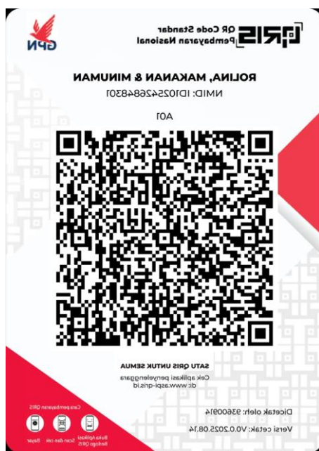
Gambar 3. Aktivasi Qris

Proses verifikasi yang dilakukan secara bertahap memberikan pengalaman langsung bagi pelaku UMKM dalam menggunakan aplikasi digital. Hal ini memperkuat literasi digital pelaku usaha sekaligus mengurangi ketergantungan terhadap bantuan pihak lain dalam pengoperasian QRIS ke depannya. Setelah proses verifikasi selesai, menunggu beberapa menit untuk menunggu aktivasi akun QRIS.