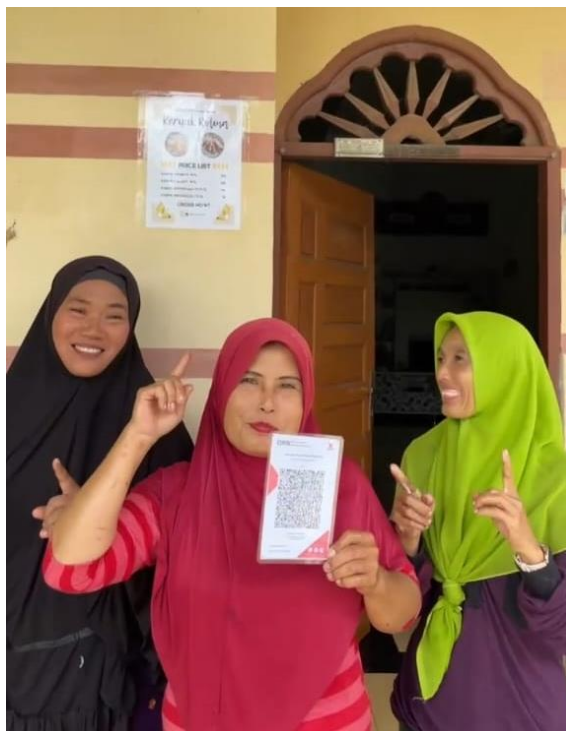
Gambar 7. Pembuatan Konten Marketing bersama Pelaku Usaha

Dalam konten tersebut, pelaku usaha ditampilkan secara langsung dengan memegang brosur produk yang berisi daftar harga serta kode QRIS resmi, sehingga tidak hanya memperkenalkan produk unggulan keripik pisang kepada konsumen, tetapi juga memberikan informasi penting bahwa sistem pembayaran digital sudah dapat digunakan di lokasi usaha. Kehadiran konten ini diharapkan mampu meningkatkan daya tarik pemasaran, memperluas jangkauan promosi, serta menumbuhkan kepercayaan pelanggan terhadap profesionalitas UMKM Keripik Pisang Rolina dalam mengikuti perkembangan teknologi pembayaran modern karena perubahan menuju sistem pembayaran digital kini menjadi strategi penting dalam memperkuat ekosistem keuangan nasional (Kurnia, 2025).