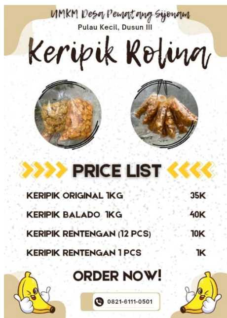
Gambar 5. Brosur Pricelist

Tidak hanya berhenti pada penyerahan QRIS, mahasiswa KKN juga membuat brosur khusus yang memuat daftar harga ( pricelist ) produk Keripik Pisang Rolina serta merancang logo sederhana sebagai identitas usaha. Menurut Wheeler (2009), logo adalah elemen visual khusus yang berfungsi sebagai representasi dari perusahaan, produk, jasa, gagasan, publikasi, maupun individu. Logo yang tepat mampu memperkuat citra, menumbuhkan kepercayaan, serta menjaga loyalitas konsumen terhadap produk atau perusahaan (Puspasari, 2023). Pembuatan logo ini bertujuan untuk memberikan citra yang lebih profesional dan mudah dikenali oleh konsumen, sedangkan brosur berfungsi sebagai media promosi yang mempermudah konsumen dalam mengetahui variasi produk serta harga yang ditawarkan.