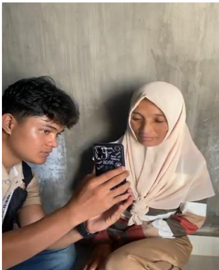
Gambar 2. Pendampingan Verifikasi Identitas Pelaku Usaha

identitas dan aktivasi akun QRIS. Tahap ini memerlukan pemahaman teknis yang lebih mendalam karena melibatkan proses unggah dokumen, konfirmasi identitas, serta sinkronisasi data usaha dengan sistem penyedia layanan pembayaran digital.