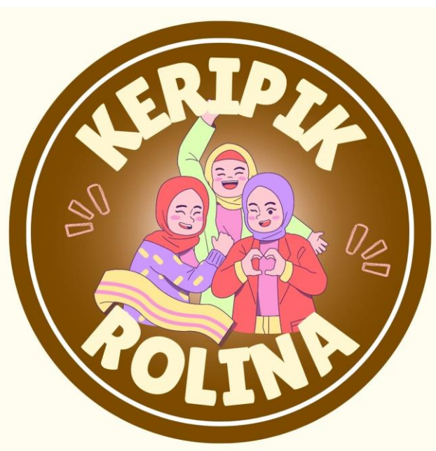
Gambar 6. Logo Usaha