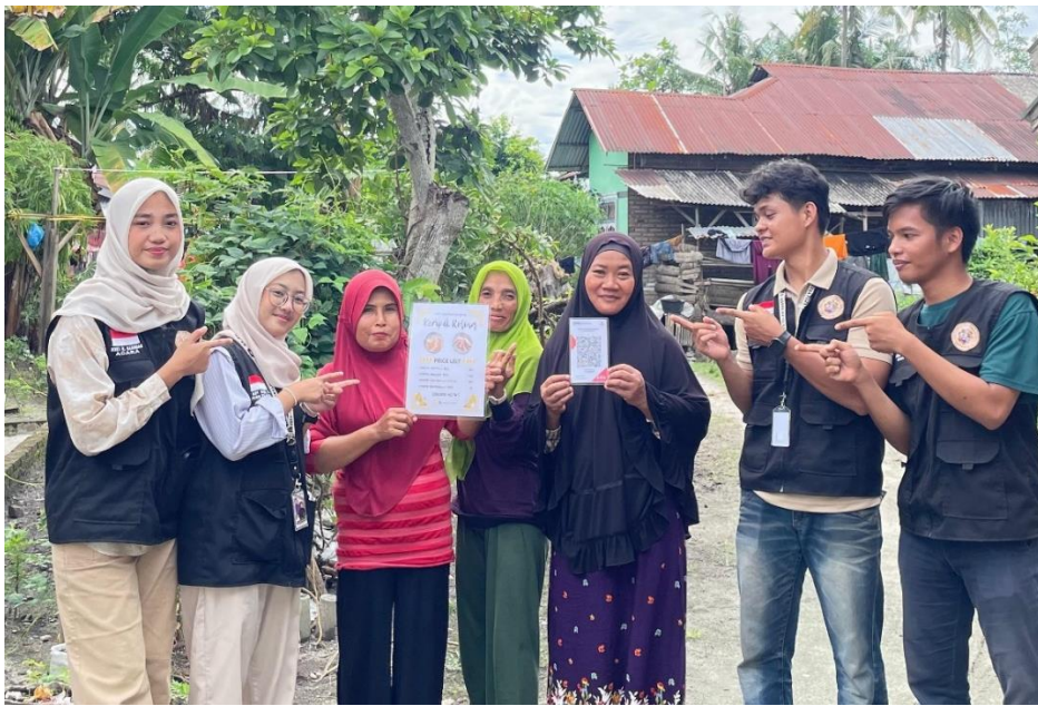
Gambar 4. Penyerahan Cetakan QRIS kepada Pelaku Usaha

Ketika proses aktivasi sudah selesai, maka akun QRIS telah berhasil. Keberhasilan aktivasi akun QRIS ditandai dengan diterbitkannya kode QR resmi yang dapat langsung digunakan sebagai metode pembayaran. Selanjutnya, mahasiswa KKN menyerahkan cetakan QRIS kepada pelaku usaha sekaligus memberikan penjelasan mengenai penempatan QR code yang strategis agar mudah diakses oleh konsumen.