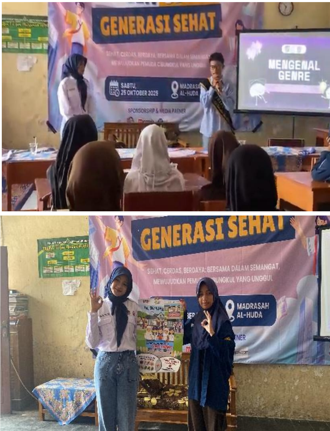
Gambar 2. Sosialisasi Forum GenRe

Dalam kegiatan ini, fasilitator menjelaskan visi, misi, dan manfaat Forum Genre, termasuk kegiatan pembinaan yang dapat diikuti remaja seperti pelatihan soft skills, pendampingan pendidikan, dan kegiatan kreatif komunitas. Kemudian, fasilitator juga menjelaskan bahwa remaja dapat mengikuti komunitas PIK-R baik di lingkungan sekolah maupun masyarakat, sebagai wadah pembinaan dan pengembangan diri bagi remaja. Fasilitator juga memperkenalkan PIK-R yang ada di Kampung Cibungkul.