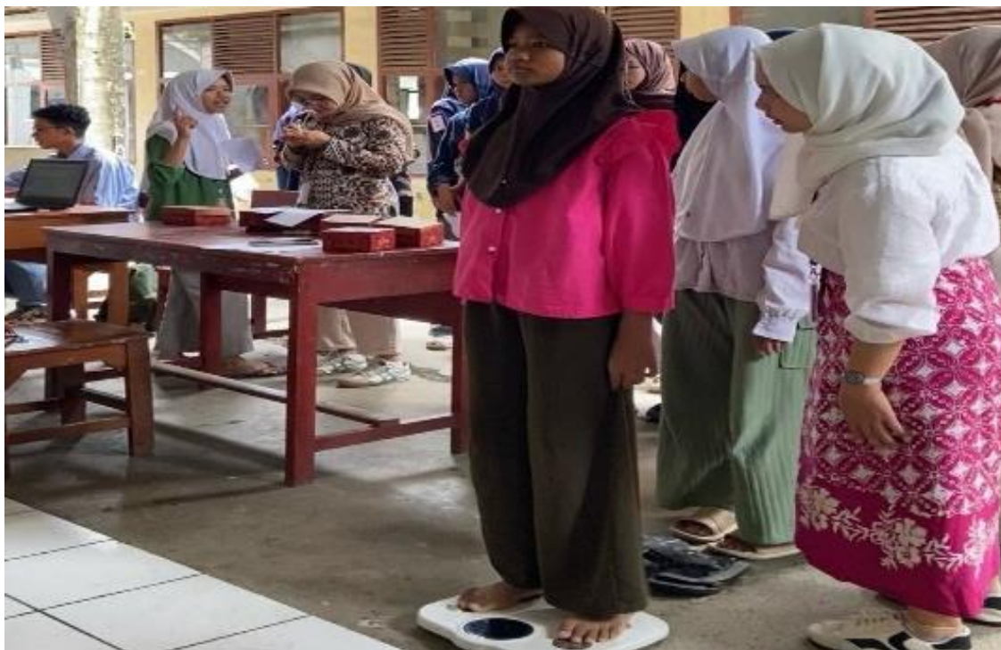
Gambar 3. Cek Kesehatan Gratis oleh Petugas Puskesmas Kecamatan Indihiang

sebelumnya, sehingga remaja dapat langsung menghubungkan informasi yang telah mereka terima dengan kondisi kesehatan aktual mereka. Pemeriksaan kesehatan gratis dilaksanakan sebagai rangkaian akhir dari kegiatan Generasi Sehat (GenSet) yang bertujuan memberikan pengalaman langsung kepada remaja terkait pentingnya memantau dan memeriksa kondisi kesehatan secara berkala setelah kegiatan GenSet ini berakhir. Berdasarkan hasil pengamatan, para peserta terlihat antusias dan bersemangat dalam mengikuti pemeriksaan kesehatan gratis ini. Selain menerima hasil pemeriksaan, peserta juga aktif berdiskusi dengan tenaga kesehatan terkait saran dan tindak lanjut yang perlu dilakukan untuk menjaga kesehatan remaja.