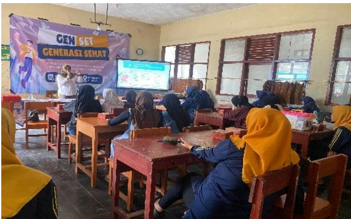
Gambar 1. Edukasi tentang Kesehatan Remaja oleh Puskesmas Kecamatan Indhiang