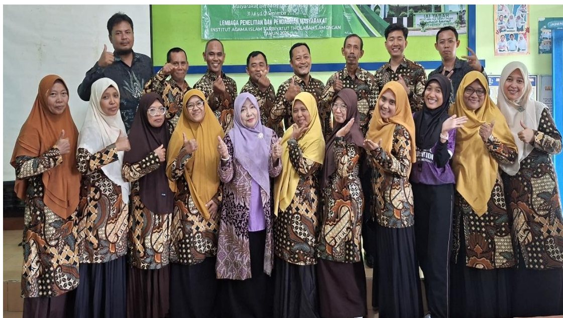
Gambar 2. Palatih dan Peserta Kegiatan Pelatihan dan Publikasi Karya Tulis Ilmiah

Tahap kedua, peserta praktek membuat artikel ilmiah yang sumbernya diambil dari skripsi guru Ketika menempuh masa studi di perguruan tinggi. Beberapa guru memiliki pilihan menentukan karya tulis bentuk apa yang akan di publish. Dalam pelatihan guru MI 02 Mazroatul Ulum Paciran memilih untuk membuat buku referensi dengan judul Kompetisi Sain Madrasah. Sedangkan guru dari MI 02 Muhammadiyah Cendoro Tuban memilih publikasi karya dalam bentuk artikel ke jurnal nasional.