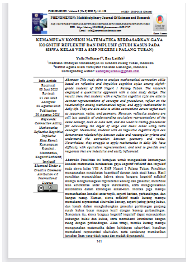
Gambar 3. Karya Guru yang terpublikasi di Jurnal Nasional

Karya tulis berupa artikel yang diperoleh dari sumber skripsi milik ibu guru atas nama Yuli Nofitasari dengan judul Kemampuan Koneksi Matematika Berdasarkan Gaya Kognitif Reflektif Dan Implusif(Studi Kasus Pada Siswa Kelas Viii A Smp Negeri 1 Palang Tuban) dipublikasi di jurnal PHENOMENON: MultidisciplinaryJournal Of Sciencesand Research di bulan september tahun 2025. Kary ini dapat diakses di link: https://azramedia-indonesia.azramediaindonesia.com/index.php/phenomenon/article/view/1747/1784