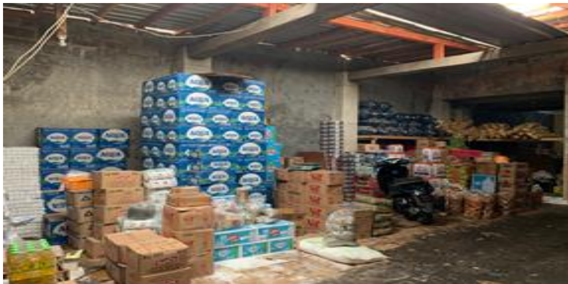
Gambar 2 Survei lapangan

Kegiatan pengabdian masyarakat dimulai dengan survei lapangan untuk mengidentifikasi masalah yang dihadapi UMKM Putra Juwana yang beralamat di Klurak Baru, Bokoharjo, Prambanan, Sleman. Survei ini difokuskan pada pemahaman pemilik usaha terhadap pengelolaan keuangan di UMKM Putra Juwana.