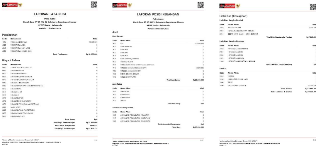
Gambar 6 Laporan Laba Rugi dan Arus Kas

Evaluasi dan monitoring dilakukan dengan menggunakan wawancara singkat dan observasi terhadap hasil kerja pelaku usaha. Hasil evaluasi menunjukkan adanya peningkatan pemahaman dan keterampilan peserta dalam menggunakan aplikasi LAMIKRO. Sebelum pelatihan, pelaku usaha belum pernah membuat laporan keuangan dalam bentuk digital. Setelah pelatihan, pelaku usaha mampu menghasilkan laporan keuangan seperti laporan laba rugi dan catatan arus kas.