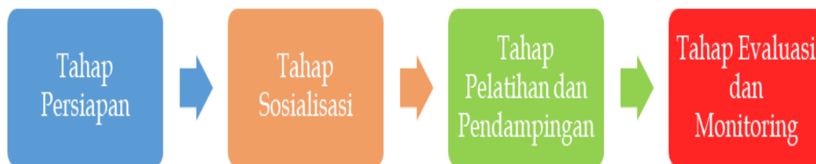
Gambar 1 Alur kegiatan pengabdian

dalam seluruh rangkaian kegiatan, mulai dari pelatihan hingga praktik langsung dalam penggunaan aplikasi LAMIKRO. Kegiatan pengabdian ini dilaksanakan melalui empat tahapan sebagai berikut: