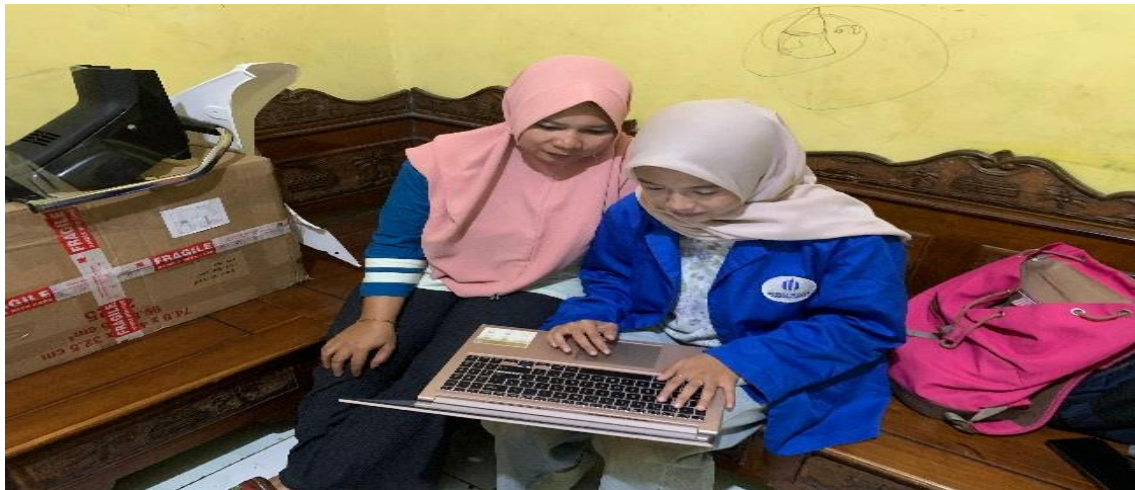
Gambar 4 Pelatihan pencatatan transaksi

Setelah berhasil membuat akun baru kemudian dilakukan simulasi pencatatan transaksi harian usaha. Pemilik UMKM Putra Juawana dilatih untuk menginput data penjualan dan pembelian, melakukan pencatatan pengeluaran operasional, menyusun jurnal transaksi, melihat laporan keuangan seperti neraca dan laba rugi. Selama pelatihan, pelaku usaha dibimbing secara individual hingga benar-benar memahami cara mengoperasikan aplikasi. Materi disampaikan secara bertahap mulai dari dasar hingga ke pembuatan laporan keuangan akhir.