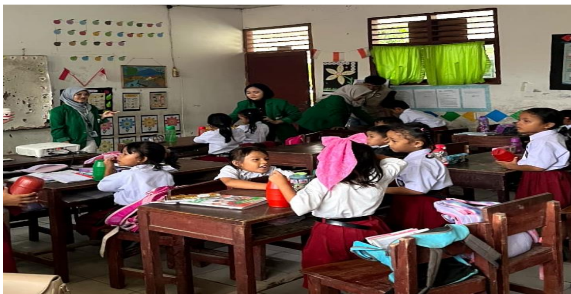
Gambar 2. Kegiatan Edukasi Menabung

diajak untuk mengenal berbagai nominal uang dan memahami bahwa uang merupakan alat tukar untuk mendapatkan barang atau jasa. Selanjutnya, melalui metode storytelling yang interaktif, anak-anak diajarkan untuk membedakan antara kebutuhan dan keinginan dengan menggunakan cerita tokoh karakter yang harus membuat keputusan dalam membelanjakan uangnya. Materi kemudian dilanjutkan dengan penjelasan tentang pentingnya menabung untuk mencapai tujuan ( goal-based saving ), di mana setiap anak diminta untuk menentukan satu barang yang ingin mereka beli dengan uang tabungan sendiri sebagai motivasi konkret. Secara praktis, anak-anak juga diajarkan cara menabung dengan menggunakan celengan yang telah disiapkan, termasuk bagaimana konsisten menyisihkan uang jajan mereka setiap hari atau minggu. Tidak kalah penting, program ini juga menekankan pengenalan nilai-nilai kejujuran dan tanggung jawab dalam mengelola uang, seperti tidak mengambil uang orang lain, jujur dalam mencatat jumlah tabungan, dan bertanggung jawab untuk tidak menggunakan uang tabungan sebelum mencapai target yang telah ditentukan. Pendekatan holistik ini bertujuan tidak hanya membentuk kebiasaan menabung, tetapi juga membangun karakter positif anak dalam mengelola sumber daya finansial sejak dini.