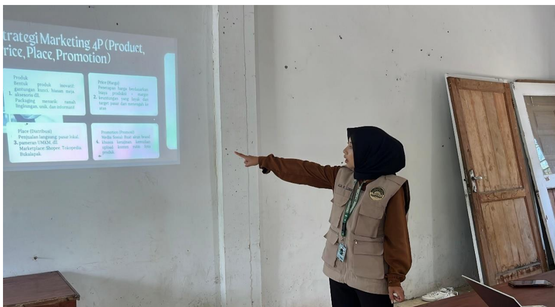
Gambar 4. Pelatihan Pemasaran Digital

Program pelatihan pemasaran produk digital dirancang untuk membantu pelaku UMKM dan peserta pelatihan kerajinan dalam memasarkan produk mereka secara online. Minimnya wawasan pemasaran digital seringkali menjadi kendala utama UMKM desa. Pelatihan Pemasaran Digital terbukti mampu mengatasi kesenjangan ini dengan cepat. Peserta yang berhasil membuat akun dan konten menunjukkan bahwa adopsi teknologi dapat terjadi asalkan didukung dengan pendampingan yang intensif dan praktik yang sederhana.