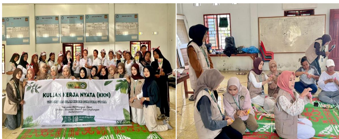
Gambar 3. Pelatihan Pembuatan Produk UMKM

Program pembuatan kerajinan dari kawat bulu dilaksanakan dengan tujuan memberikan keterampilan alternatif kepada masyarakat untuk menciptakan produk bernilai ekonomis dengan modal yang terjangkau. Pelatihan kerajinan kawat bulu membuka peluang diversifikasi produk UMKM di Desa Sampe Raya. Keterampilan baru ini dapat mengurangi ketergantungan pada produk pertanian atau jasa wisata tradisional. Aspek penting dari pelatihan ini adalah peningkatan kreativitas dan inovasi yang merupakan modal kunci bagi UMKM untuk bersaing di pasar modern. Dengan adanya produk baru, potensi peningkatan pendapatan masyarakat melalui penjualan produk kreatif juga semakin terbuka