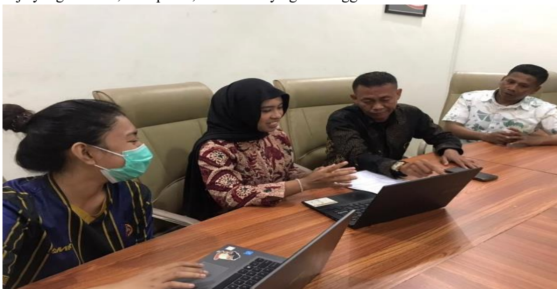
Sumber: Dokumentasi pribadi (2025)

Sebelum penerapan aplikasi online berbasis Google Form, proses rekapitulasi laporan kegiatan satpam di PT Garda Wira Karya masih dilakukan secara manual melalui grup WhatsApp yang membutuhkan waktu dua hingga tiga hari karena petugas harus menelusuri ulang pesan satu per satu sebelum data dapat disusun ke dalam format laporan bulanan. Proses ini juga sering kali menyebabkan keterlambatan pengumpulan data, duplikasi informasi, dan kesalahan pencatatan yang berdampak pada lambatnya penyusunan laporan akhir bulan. Langkah ini menunjukkan komitmen PT Garda Wira Karya untuk beradaptasi dengan perkembangan teknologi digital dan membangun sistem kerja yang modern, transparan, serta berdaya guna tinggi.