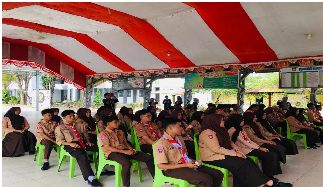
Gambar 1 Penerimaan Materi Sosialisasi

mengaktualisasikan perannya dalam preservasi cagar budaya. Melalui implementasi program edukasi dan sosialisasi, diharapkan nilai-nilai intrinsik yang melekat pada objek cagar budaya di wilayah kota Gorontalo dapat mentransformasikan pemahaman mengenai nilai esensial cagar budaya menjadi suatu kepedulian kolektif dan pola perilaku positif yang berkelanjutan dalam menjaga integritas warisan budaya.