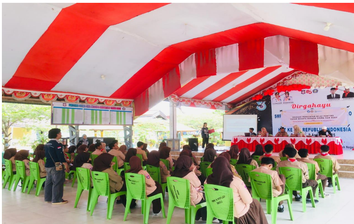
Gambar 2 Penyampaian Materi Sosialisasi oleh Pemateri

Dalam pelaksanaan sosialisasi Edukasi kepada siswa dan guru ini, Peserta menunjukkan peningkatan pemahaman dimana siswa lebih mengenal objek bersejarah, cagar budaya, serta nilai penting untuk melestarikan objek-objek tersebut. Pada sesi diskusi para guru pun ikut memberikan pendapat terkait benda dan bangunan warisan budaya di Kota Gorontalo.