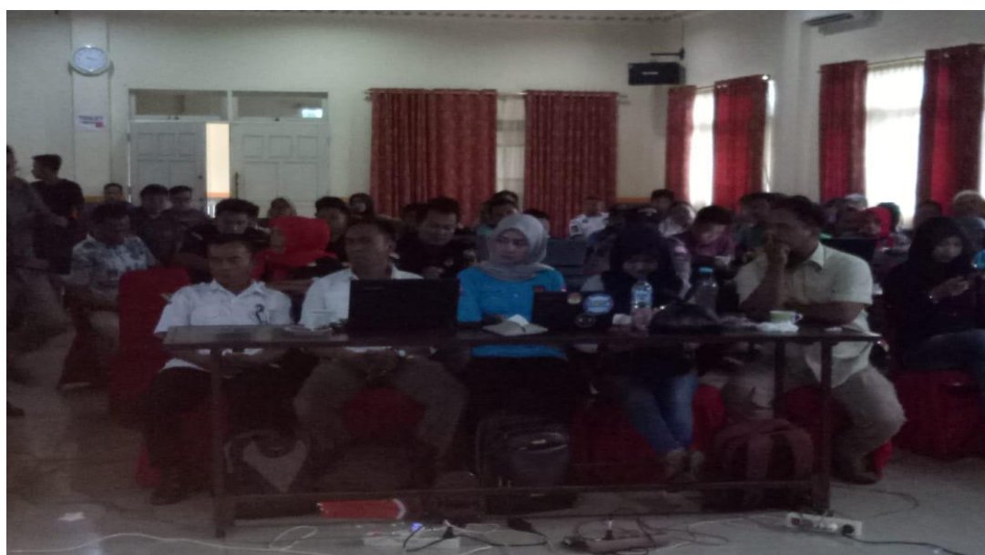
Gambar 2. Peserta Lagi Mendengarkan Materi