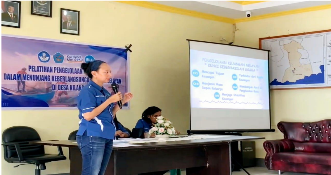
Gambar 3. Pemberian Materi oleh Narasumber dan Sesi Diskusi

Kegiatan pelatihan pengelolaan keuangan bagi para nelayan diawali dengan sambutan Kepala Desa Kilang sebagai Mitra utama dalam kegiatan pengabdian dan Opening Speech oleh Ketua Tim PkM. Setelah pembukaan kegiatan, dilanjutkan dengan pemberian materi oleh narasumber dan diskusi dengan peserta.