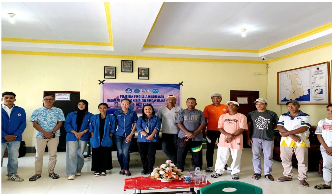
Gambar 4. Dokumentasi Bersama Kepala Desa dan Nelayan Desa Kilang

Pada akhir kegiatan, dilakukan sesi dokumentasi bersama dengan Kepala Desa dan para nelayan di Desa Kilang.