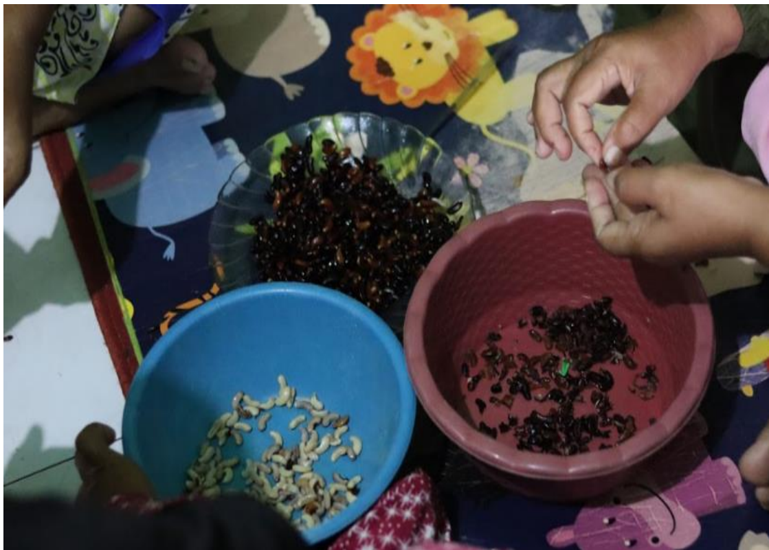
Gambar 3. Proses Pembuatan Tempe Kacang Panjang

Dalam proses pengolahan biji kacang panjang menjadi tempe dibutuhkan kacang panjang yang tua di pohon karena, biji yang dapat diolah menjadi tempe adalah biji yang kering. Setelah biji kacang panjang dipisahkan dari daging buahnya, kemudian masuk dalam tahap perendaman selama 12 jam (Gambar 3). Setelah proses perendaman tersebut biji kacang panjang direbus 2 kali untuk dipisahkan dari kulit arinya dan untuk menghilangkan baunya.