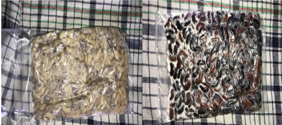
Gambar 4. Dua Sample Percobaan Tempe Kacang Panjang

Dilakukan dua sampel percobaan untuk tempe kacang panjang yakni biji yang masih ada kulit arinya dan yang sudah bersih dari kulit ari, tujuan dari dibuatnya 2 sampel tersebut untuk mengetahui peragian dengan cara apa yang lebih cepat menjadi tempe, dapat dilihat pada Gambar 4. Setelah biji kacang panjang tersebut dingin selanjutnya dilakukan tahap peragian dan pengemasan ke dalam plastik. Tujuan penggunaan plastik untuk pengemasan adalah agar mudah dipantau setiap harinya, dan untuk mengetahui proses peragian berhasil atau gagal. Adapun pada hari ke-2 pemantauan progres tempe kacang panjang sudah mulai mengalami perubahan bentuk.