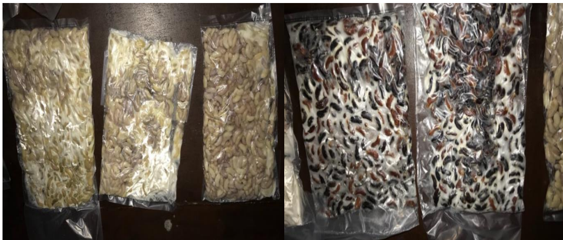
Gambar 5. Tempe Kacang Panjang Pada Hari-3

Setelah 3 hari menunggu proses peragian ternyata tempe yang masih terdapat kulit arinya jauh lebih berhasil ketimbang yang tidak ada kulit arinya. Sehingga bisa dikatakan bahwa Program Pengolahan Biji Kacang Panjang menjadi Tempe berhasil karena dapat dikonsumsi. Progres Tempe Kacang Panjang Pada Hari-3 dapat dilihat pada Gambar 5.