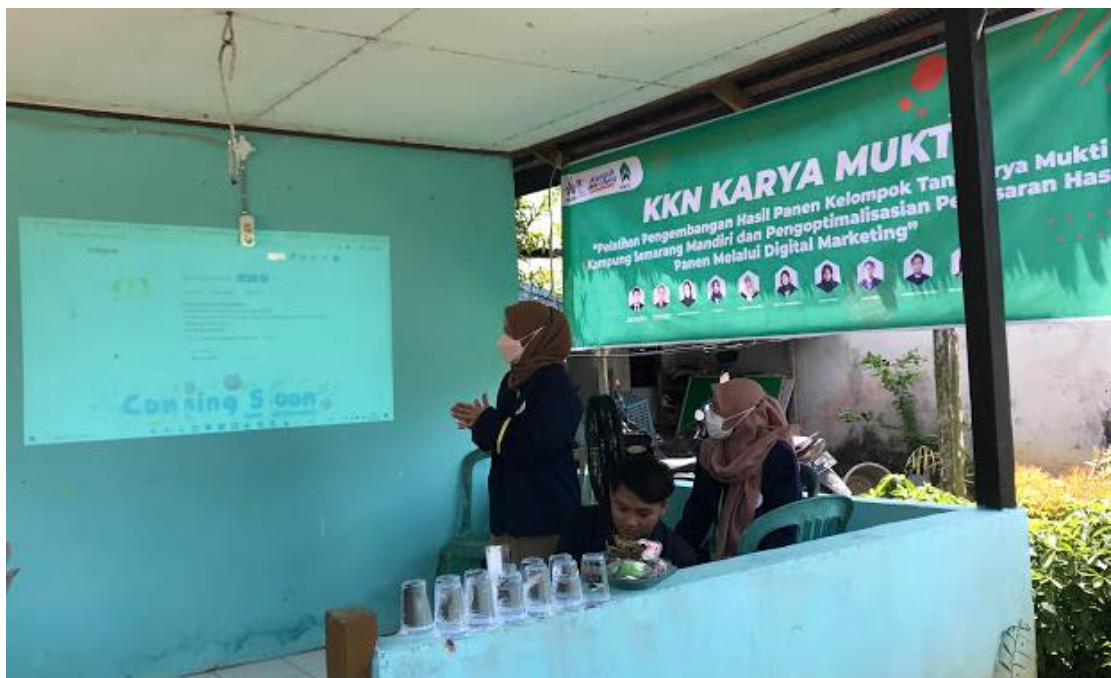
Gambar 1. Pelaksanaan Sosialisasi Digital Marketing

Adapun waktu dari pelaksanaan Pengabdian Masyarakat direncanakan sejak awal November 2021, dimulai dengan berdiskusi dengan kelompok Tani Karya Mukti Kampung Semarang Mandiri. Kegiatan mulai dilaksanakan pada bulan Februari 2022 hingga bulan Mei 2022. Lokasi pelaksanaan Pengabdian Masyarakat ini adalah di Jalan Giri Rejo RT 27 Kampung Semarang Mandiri tepatnya di Kecamatan Balikpapan Utara, Kota Balikpapan terletak pada KM 15 Karang Joang di provinsi Kalimantan Timur.