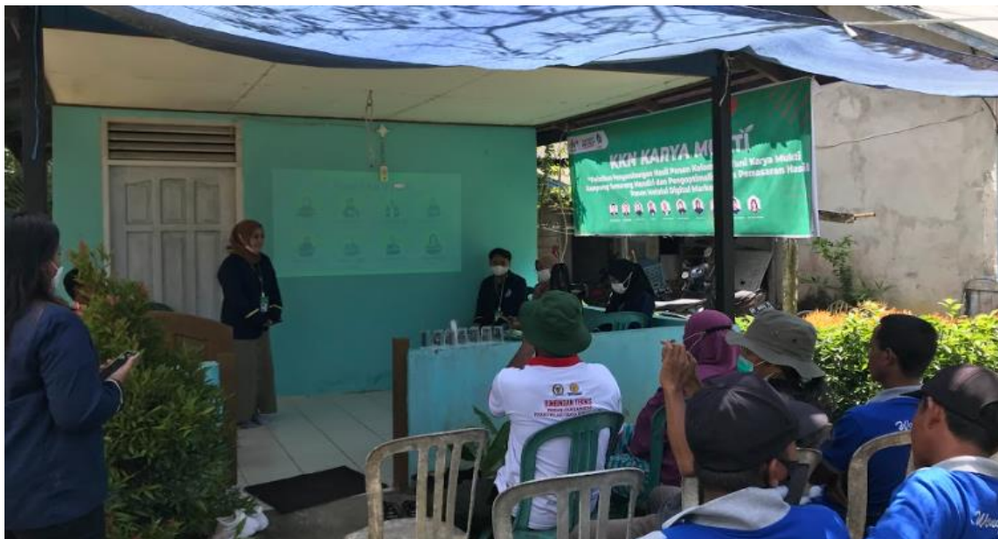
Gambar 6. Tempe Kacang Panjang Pada Hari-3

Program sosialisasi digital marketing (Gambar 6) merupakan kegiatan yang dilakukan untuk memberikan pemahaman mengenai peran digital marketing dalam upaya meningkatkan penjualan produk UMKM Kelompok Tani Karya Mukti, Kecamatan Balikpapan Utara. Dengan adanya kemajuan teknologi, tentu saja mempermudah segala kegiatan maupun aktivitas masyarakat, salah satunya dapat digunakan para petani untuk pemasaran hasil panennya. Digital marketing ini dapat membantu petani Karya Mukti untuk pemasaran hasil panen hortikultura, bengkoang, dan juga jamur yang menjadi komoditas utama di kelompok mereka. Para petani Karya Mukti diajak untuk dapat menggunakan WhatsApp Business dalam penjualan dengan sasaran utama adalah mahasiswa/i yang bertempat tinggal di sekitar kilo 15. Dalam sosialisasi digital marketing ini juga diajarkan cara menggunakan sosial media berupa Facebook, Instagram, dan Website yang bisa digunakan para petani untuk memudahkan pemasaran hasil panennya.