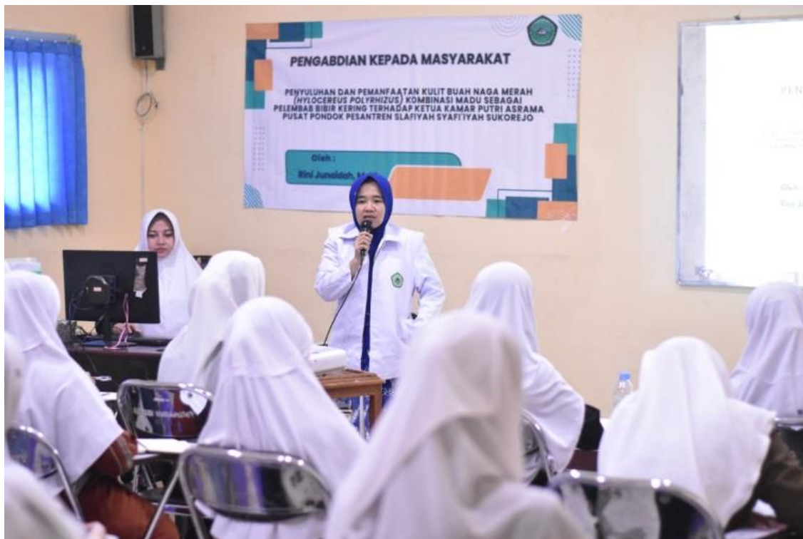
Gambar 1. Penyampaian Materi dan Sosialisasi

antusias mengikuti kegiatan dari awal sampai akhir. Ada beberapa pertanyaan yang ditanyakan mitra mengenai materi yang belum dimengerti.