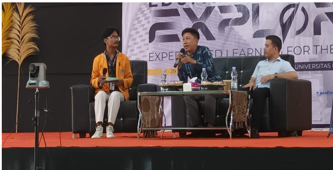
Gambar 1. Talkshow 2024 Di Universitas Negeri Makassar Dengan Narasumber Dan Moderator Membahas Etika Bermedia, Konten Digital, Dan Kreativitas Mahasiswa

informasi pribadi di media sosial dan lebih memperhatikan dampak dari tindakan online mereka. Selain itu, partisipasi dalam diskusi dan dialog juga membantu mereka untuk lebih memahami konsep-konsep tersebut secara lebih mendalam.