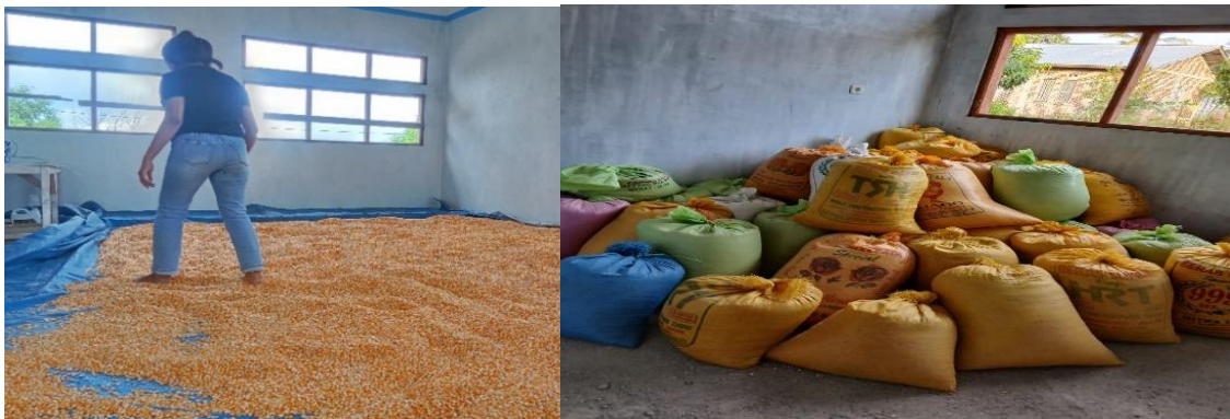
Gambar 3. Proses Penjemuran Dan Pengemasan Jagung

karung jagung dan menyiapkan label sesuai kebutuhan kelompok tani. Kegiatan ini menjadi penutup dari seluruh proses pengolahan hasil panen.