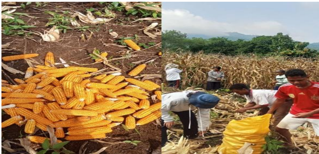
Gambar 1. Proses Panen Jagung

keakraban ini menjadi momen yang mempererat hubungan antara tim pengabdian dan warga.