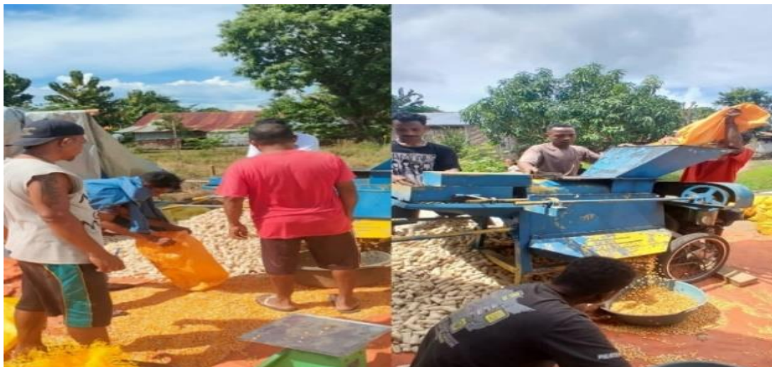
Gambar 2. Proses Luruh Jagung

Ketiga , Proses Penjemuran Jagung. Biji jagung yang telah diluruh kemudian dijemur di bawah sinar matahari. Kami membantu menyiapkan tempat penjemuran, menyebarkan biji jagung di atas terpal, serta secara berkala membaliknya agar kering secara merata. Kami juga bersama-sama menjaga agar jagung tidak terkena air hujan atau gangguan hewan. Proses ini sangat penting untuk menjaga kualitas dan daya simpan jagung.