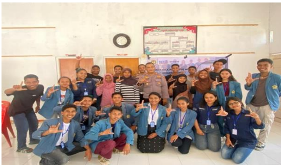
Gambar 2. Foto Bersama

Namun demikian, terdapat pula sejumlah tantangan yang perlu dicatat. Salah satunya adalah hambatan bahasa dalam penyampaian materi. Meskipun peserta memahami Bahasa Indonesia, sebagian besar lebih terbiasa menggunakan bahasa daerah dalam komunikasi sehari-hari, sehingga beberapa istilah teknis perlu dijelaskan secara lebih sederhana dan kontekstual. Tantangan lain adalah keterbatasan waktu yang membuat beberapa topik tidak dapat dibahas secara mendalam, seperti strategi menghadapi cyberbullying atau cara melaporkan konten negatif di media sosial.