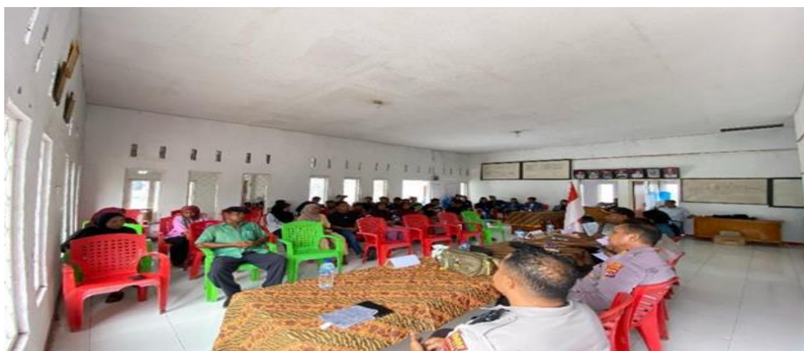
Gambar 1. Sosialisasi bersama Tim pengabdian dan Polresta Lembata dan Anak-Anak Remaja

Selain berfokus pada remaja, pengabdian ini juga secara tidak langsung menyentuh aspek peran keluarga dan lingkungan sosial dalam membentuk pola penggunaan media sosial. Hasil observasi menunjukkan bahwa sebagian besar remaja mengakses media sosial secara bebas tanpa pengawasan yang memadai dari orang tua. Hal ini diperparah dengan rendahnya literasi digital orang tua, sehingga mereka tidak mampu memberikan arahan yang tepat atau mendeteksi potensi risiko digital yang dihadapi anak-anak mereka. Beberapa tokoh masyarakat yang hadir dalam kegiatan juga menyampaikan keprihatinan mereka terhadap pola pergaulan remaja yang lebih banyak menghabiskan waktu di dunia maya dari pada berinteraksi langsung dengan sesama. Mereka mengapresiasi kegiatan ini dan berharap dapat dilakukan secara berkelanjutan dengan melibatkan lebih banyak elemen desa, seperti guru, pemuka agama, dan karang taruna.