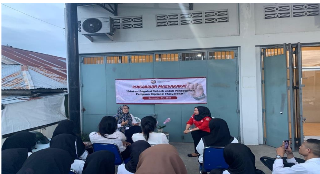
Gambar 1. Dokumentasi Kegiatan Pengabdian

Mayoritas responden memperoleh informasi tentang fintech dari media sosial dan teman, bukan dari sumber resmi. Hanya 4 yang pernah mendapat edukasi formal tentang fintech dari lembaga keuangan atau pemerintah. Sebanyak 34 responden menyatakan membutuhkan edukasi lebih lanjut tentang regulasi fintech dan cara mencegah penipuan digital.