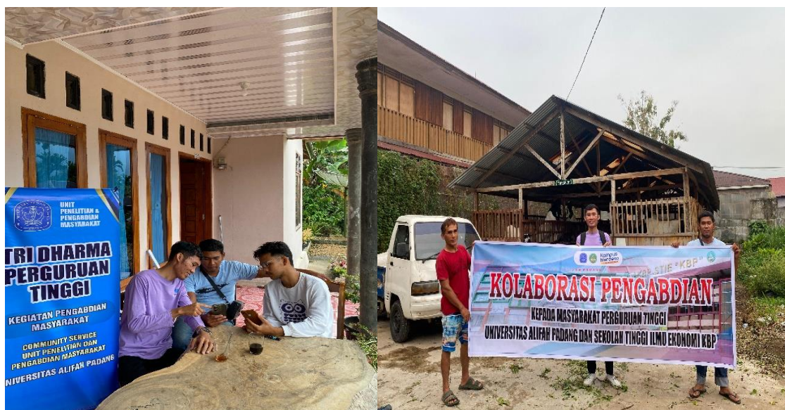
Gambar 1. Dokumentasi Sosialisasi dan Pengenalan Aplikasi Zahir Accounting

Beberapa dokumentasi berupa foto kegiatan, disajikan pada gambar-gambar di bawah ini.