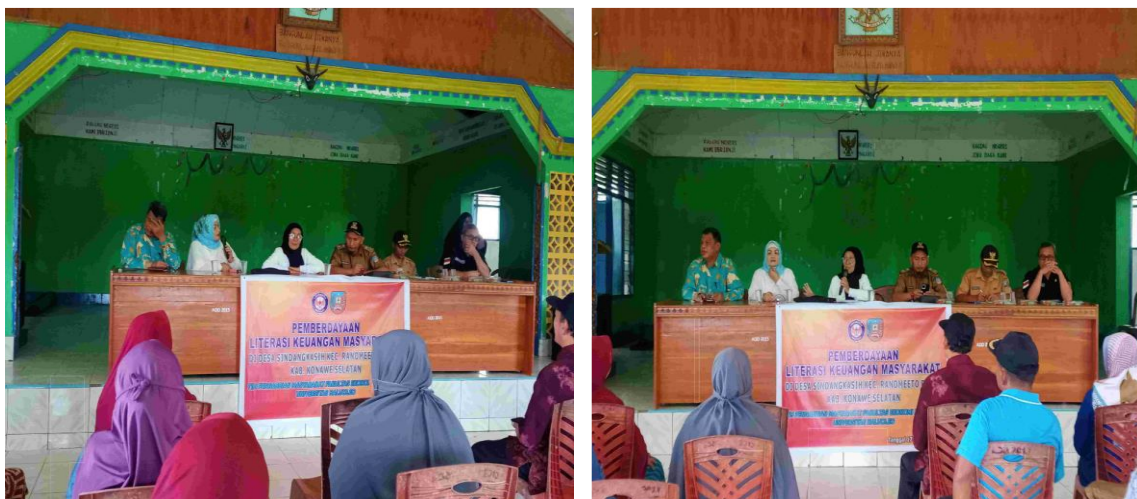
Gambar 1. Tim Pengabdian Menyampaikan Ceramah dan Edukasi Litresi Keuangan

keuangan, kemampuan berkomunikasi dan akses ke lembaga Keuangan bank dan nonbank sesuai kebutuhan masyarakat, ketrampilan dan kecakapan mengelola keuangan, ketrampilan mengambil keputusan tentang keuangan, percaya diri dan mampu mengelola keuangan secara efektif dan efisien. Sehingga masyarakat desa Sindangkasih mampu untuk menyambut pengembangan inklusi keuangan oleh Lembaga keuangan di Indonesia. Kemudian dilanjutkan dengan penjelasan peran dan fungsinya lembaga tersebut diantara; Bank Indonesi, Otoritas Jasa Keuangan, Bank Umum, bank syariah, Lembaga Penjamin Simpanan, Bank Perkreditan Rakyat dan Asuransi. Kemudian peserta diedukasi tentang Perhitungan keuntungan dan resiko tabungan, deposito, kredit, investasi pada lembaga Keuangan. Kemudian Meningkatkan keyakinan terhadap Lembaga Keuangan, sikap dan perilaku Keuangan yang efektif dan efisien. Agar peserta bersemangat untuk mengembangkan usaha guna menjaga kelanjutan usaha dan pendapatan rumah tangga dan masyarakat.