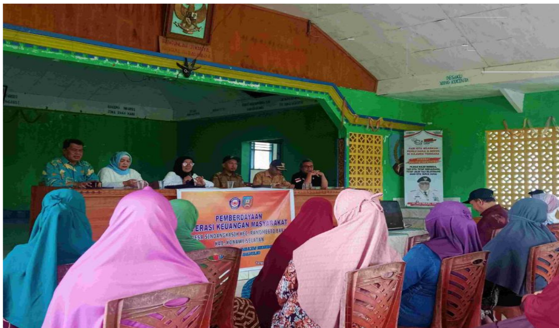
Gambar 2. Diskusi Interkatif Tim Pengabdian dan Peserta Program Pengabdian