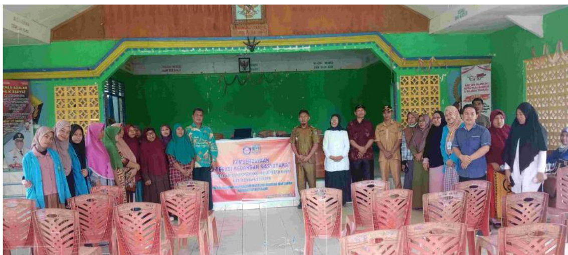
Gambar 3. Foto Bersama Peserta Program dan Aparat Desa Sindangkasih

Untuk mengevaluasi luaran dari kegiatan program pengabdian yang telah dilaksanakan, terkait pentingnya pemahaman masyarakat mengenai literasi Keuangan agar dapat dengan efisien mengakses inklusi Keuangan yang dikembangkan oleh Lembaga perbankan dan terhindar dari kerugian finansial dari penyalahgunaan pihak tertentu. Pelaksanaan evaluasi secara lisan bersamaan dengan diskusi dan lembaran kuestioner sederhana yang diedarkan pelaksana program. Kemudian diisi oleh peserta guna menguji keberhasilan program tersebut, guna mengevaluasi keberlanjutan program berikutnya