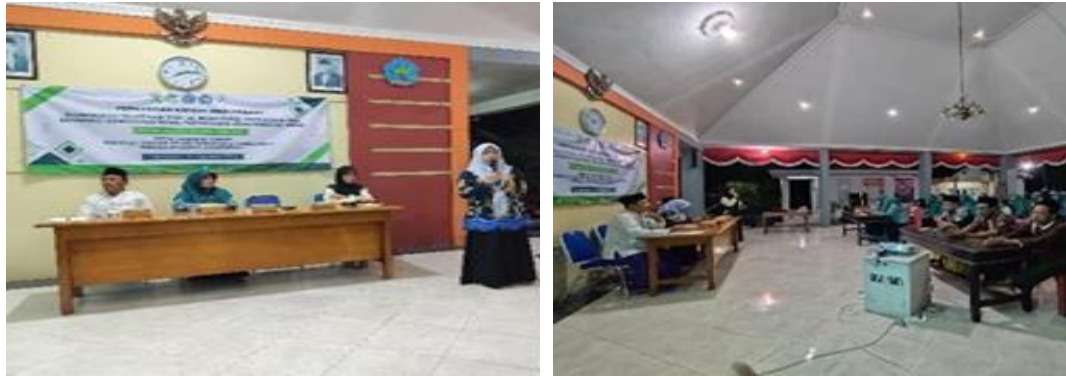
Gambar 2. Sosialisasi dan Penentuan Logo Brand Pertanian Karangtawar

kurang lebih dihadiri 60 orang yang bertempat di balai desa Karangtawar dari pukul 19.30 WIB sampai selesai.