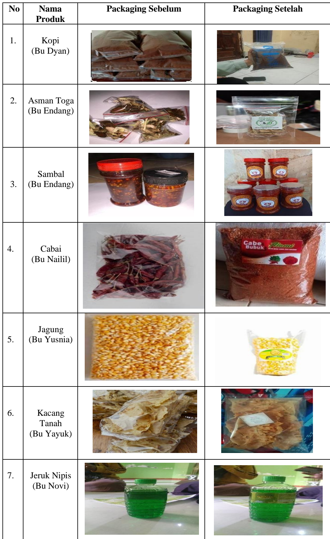
Tabel 12. Data Nama Produk Sebelum dan Sesudah yang Berpackaging