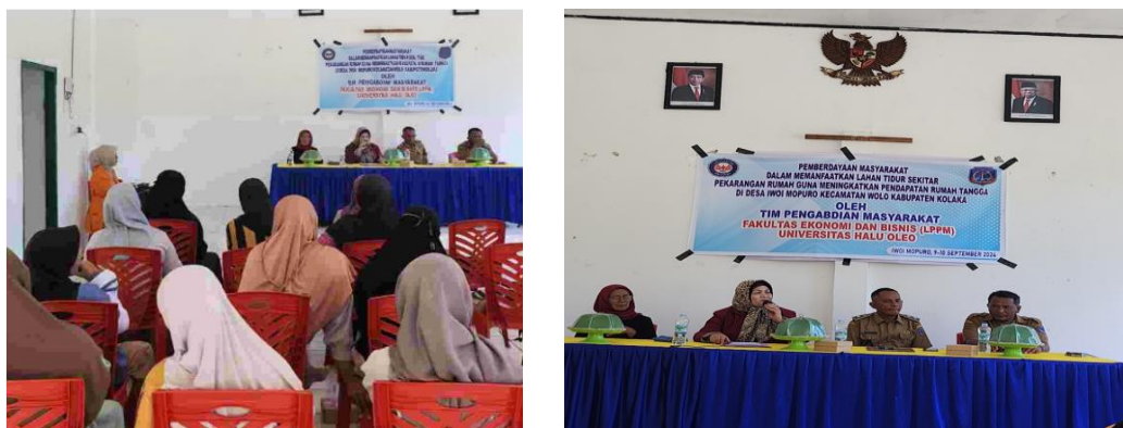
Gambar 1. Pemaparan Materi oleh Tim Pengabdian Masyarakat

Narasumber menyampaikan presentasi secara interaktif untuk meningkatkan kesadaran tentang pentingnya pemanfaatan lahan pekarangan yang selama ini sering dibiarkan kosong yang sebenarnya memiliki potensi besar jika dimanfaatkan secara optimal. Dengan menanam sayuran dan tanaman obat-obatan, masyarakat dapat memenuhi kebutuhan sehari-hari secara mandiri tanpa harus bergantung pada pasar. Tanaman seperti kangkung, bayam, cabai, dan tomat dapat menjadi sumber pangan segar, sementara jahe, kunyit, kencur, dan sirih dapat digunakan sebagai obat tradisional. Selain itu, kegiatan bercocok tanam di pekarangan juga dapat menjadi sarana edukasi bagi keluarga, terutama anak-anak, untuk mengenal sumber pangan dan pentingnya hidup sehat. Dengan demikian, pemanfaatan lahan pekarangan tidak hanya meningkatkan ketersediaan bahan pangan tetapi juga mendukung gaya hidup yang lebih sehat dan berkelanjutan.