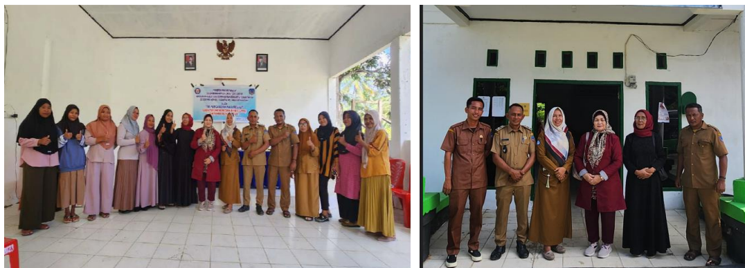
Gambar 4. Aparat Desa Iwoimopuro, Tim Pengabdian dan Beberapa Peserta

Evaluasi dari pelatihan tersebut adalah dengan tanya jawab secara lisan mengisi kuestioner yang disiapkan team pengabdian UHO. Dari antusiasnya peserta dan rekap jawaban tertulis dari kuestioner program pengabdian ini telah berhasil mengubah pola pikir untuk memanfaatkan lahan kosong disekitar pekarangan untuk tanaman obat-obatan tradisional dan tanaman pangan sehari. Diharapkan dapat meningkatkan pendapatan keluarga karena dapat dijual dan dipakai sendiri dengan tujuan efisiensi pengeluaran rumah tangga.