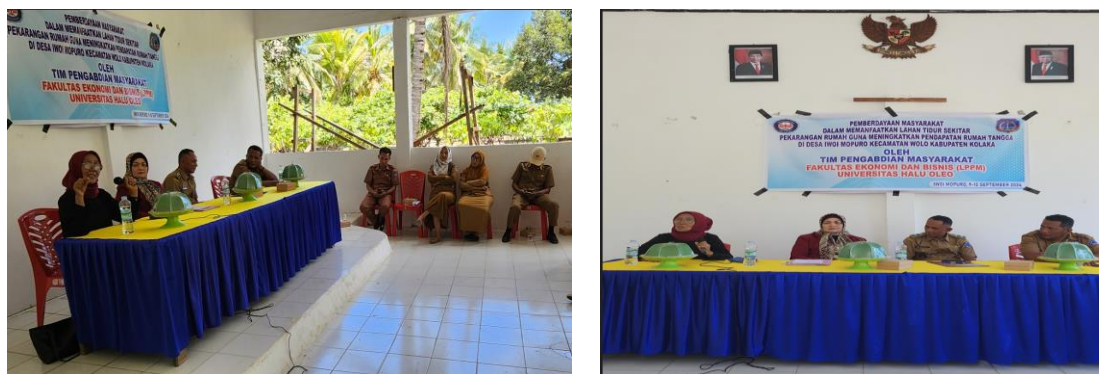
Gambar 2. Sesi Diskusi

Setelah memberikan ceramah motivasi dan edukasi pentingnya pemanfaatan lahan pekarangan. Sesi berikutnya adalah diskusi dengan khalayak sasaran. Diskusi tentang bagaimana tanaman yang dipilih dapat dikembangkan menjadi bisnis skala kecil. Mengeksplorasi peluang pasar dan produk bernilai tambah berdasarkan potensi lokal.