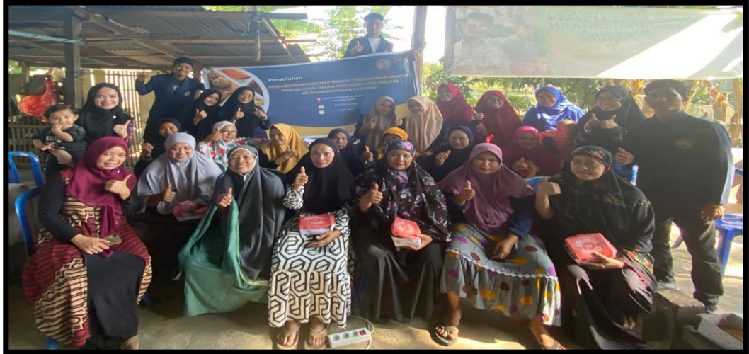
Gambar 7. Kegiatan pelatihan tentang pembuatan brownies tepung ubi jalar bersama Kelompok Wanita Tani Asoka