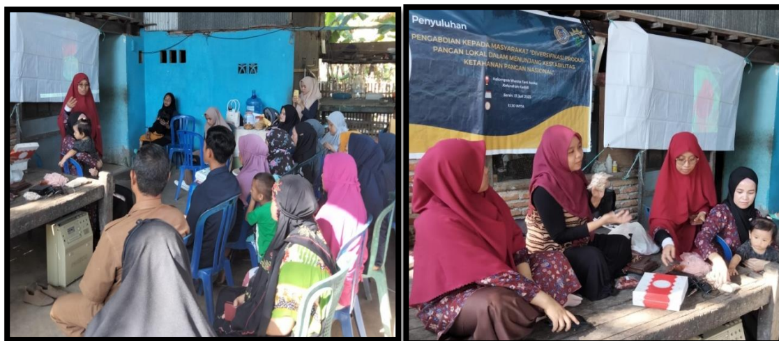
Gambar 3.1 dan 3.2. Kegiatan penyuluhan “Diversifikasi produk pangan lokal dalam menunjang ketahanan pangan nasional” di Kelompok Wanita Tani Asoka