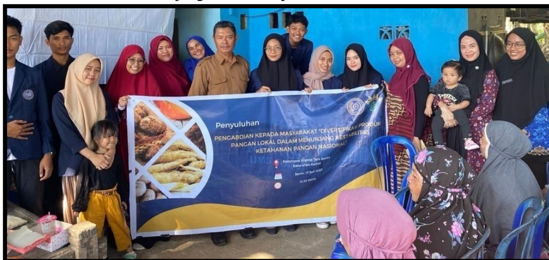
Gambar 3. Foto bersama dengan para dosen yang terlibat, mahasiswa, Ketua BPP Pancarijang dan Kelompok Wanita Tani Asoka