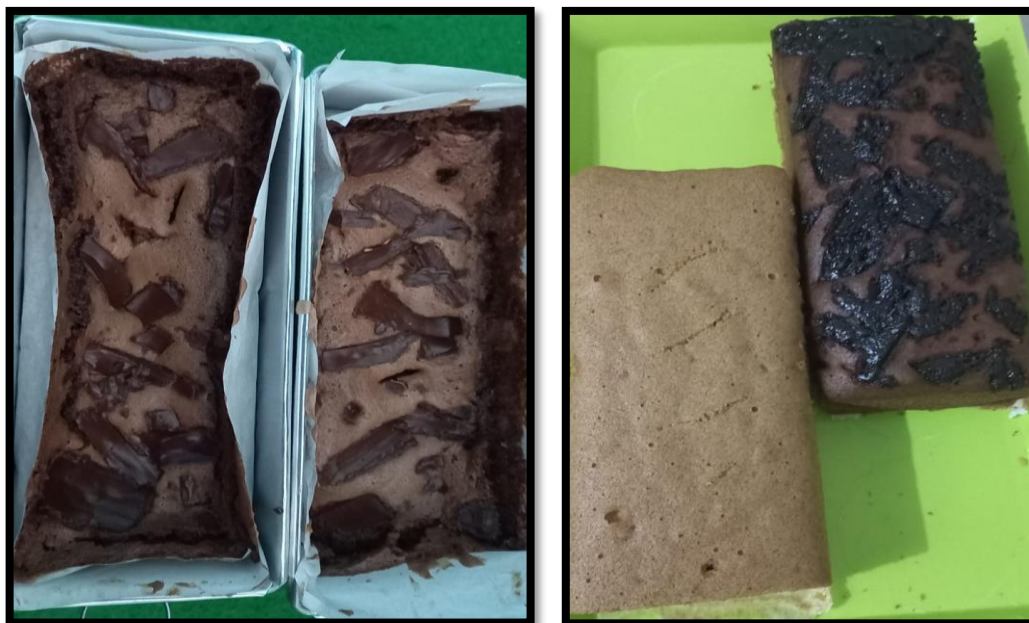
Gambar 3.9. Brownies Tepung Ubi Jalar : a. Panggang; b. Kukus