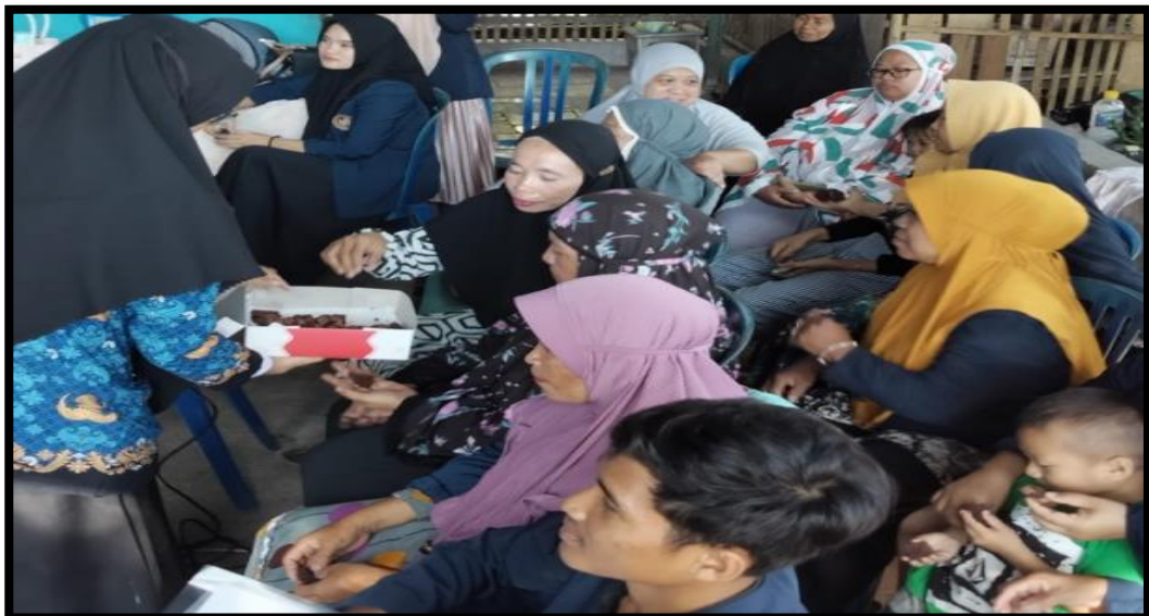
Gambar 8. Uji Coba Produk Brownies Tepung Ubi Jalar