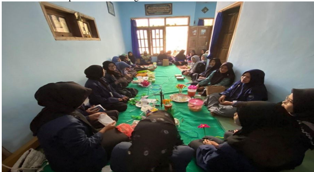
Gambar 3.2. Tahap Pelaksanaan Kegiatan PkM