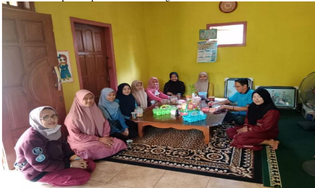
Gambar 1. Tahap Persiapan Pelaksanaan Kegiatan PkM