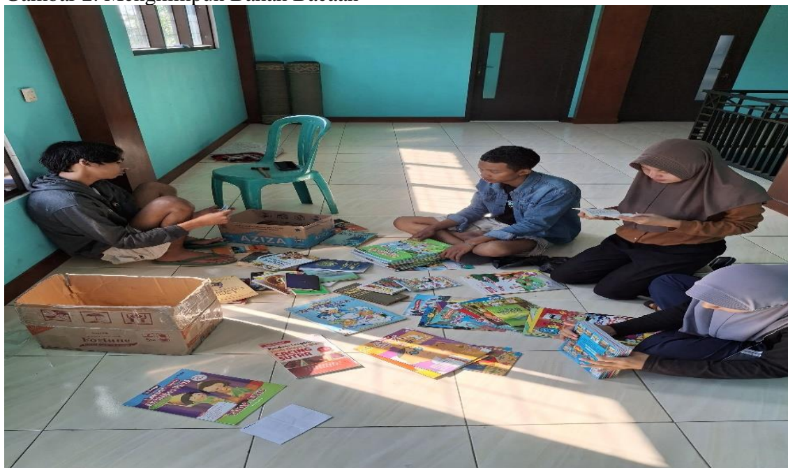
Gambar 2. Menghimpun Bahan Bacaan