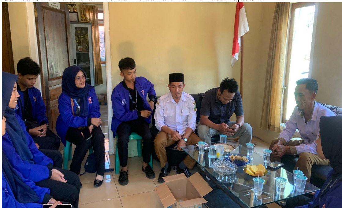
Gambar 3.1. Melakukan Diskusi Bersama Pihak Pemdes Rajadanu