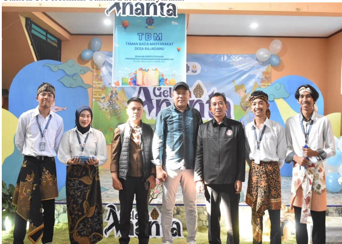
Gambar 3. Peresmian Taman Baca Masyarakat