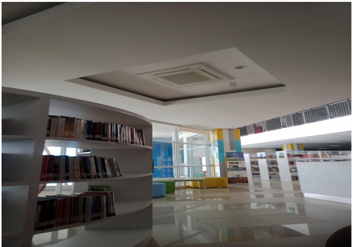
Gambar 3.3 Bagian Ruang Perustakaan