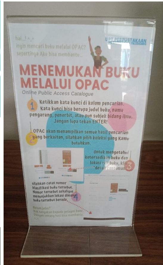
Gambar 3.2 Bagian Tampilan Cara Menggunakan Aplikasi SLiMS