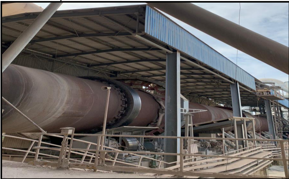
Gambar 1.1 Rotary Kiln

Rotary kiln merupakan perangkat pyroprocessing yang digunakan untuk meningkatkan suhu tinggi (kalsinasi) campuran utama produk semen untuk proses berkelanjutan. Rotary kiln adalah sebuah bejana silindris yang horizontal namun sedikit miring, saat rotary kiln berputar seluruh campuran bahan tersebut bergerak ke bawah. Bahan bakar rotary kiln ini berupa solar sebagai bahan bakar pada saat start up pembakaran kiln . Selama di dalam kiln , raw meal dikenai proses: pengeringan, dehidrasi, dekomposisi dan kalsinasi, klinkerisasi.