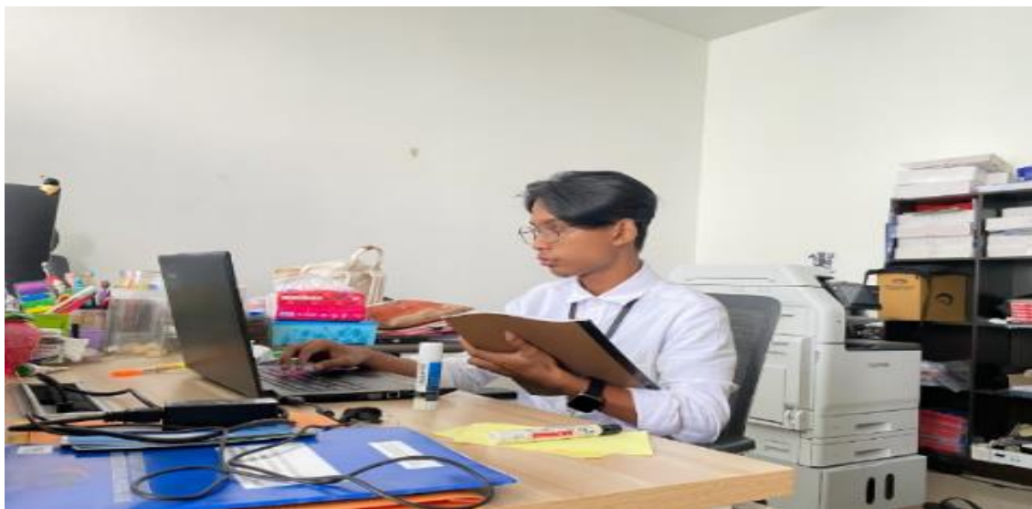
Gambar 1. Rekap Berkas Arsip Inaktif

dari kegiatan audit dan asistensi yang telah dilaksanakan oleh BPKP Perwakilan Provinsi Kalimantan Tengah. Setelah data berhasil direkap ke dalam spreadsheet Excel , setiap berkas diberi label nomor sebagai penanda identitas agar lebih tertata. Setelah pemberian label nomor selesai, seluruh berkas dimasukkan kembali ke dalam boks penyimpanan arsip inaktif sesuai dengan urutan dan kode yang telah direkam di Excel . Boks tersebut juga diberi label untuk memudahkan pencarian di kemudian hari. Seluruh rangkaian proses ini diterapkan pada dokumen arsip inaktif hasil pengauditan, sehingga setiap bukti dan temuan audit tersimpan rapi baik dalam sistem digital ( Excel ) maupun fisik (boks bernomor) yang saling terintegrasi, guna memudahkan pencarian dan pelacakan di masa mendatang.