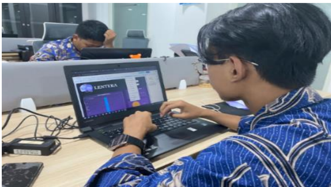
Gambar 2. Pembuatan Lentera melalui Looker Studio

peminjaman sebelumnya. Pengguna yang membutuhkan arsip cukup mengakses website Lentera tersebut, mencari berkas yang diperlukan, lalu mengajukan permintaan peminjaman secara digital. Petugas arsip dapat melihat semua permintaan masuk melalui dasbor Looker Studio, kemudian memproses pencarian arsip fisik berdasarkan data yang telah terintegrasi. Dengan adanya Lentera yang terhubung dengan tampilan Looker Studio, proses peminjaman berkas arsip inaktif menjadi lebih mudah, transparan, dan terdokumentasi dengan rapi tanpa harus membuka box penyimpanan secara manual setiap kali ada permintaan.