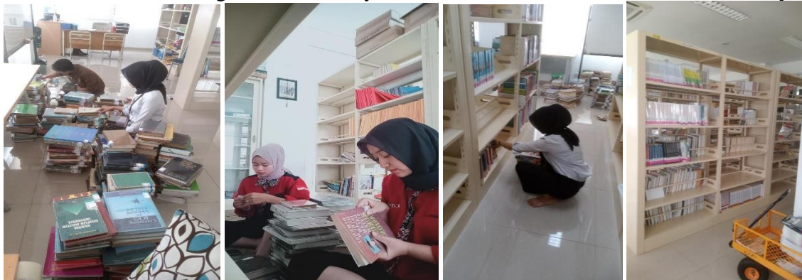
Gambar 4.3 Proses Pengebelan & Menyusun Buku Berdasarkan Nomor Klasifikasinya