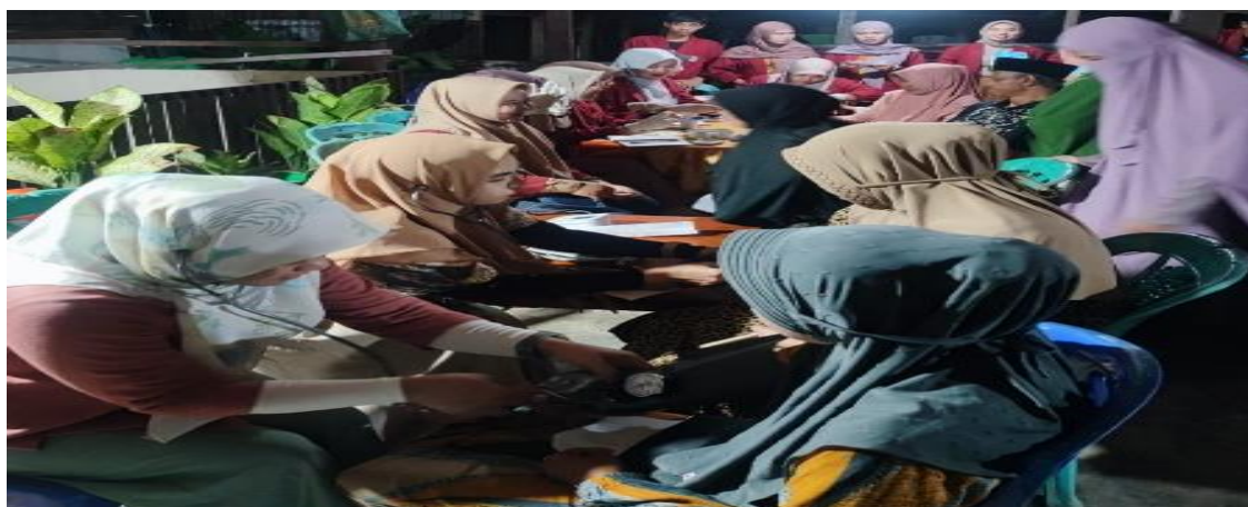
Gambar 1. Kegiatan Pemeriksaan Kesehatan Gratis

Berdasarkan hasil penyuluhan langsung serta mengadakan tanya jawab kepada peserta selama kegiatan berlangsung ,Kegiatan pengabdian masyarakat ini memberikan hasil yaitu meningkatnya pengetahuan mitra mengenai pemeriksaan kesehatan gratis, mitra akan menerepkan pola hidup sehat dalam kehidupan sehari-hari, jika kegiatan penyuluhan ini sering diadakan,diharapkan dapat menekan peningkatan penyakit tidak menular. Pada pemeriksaan kesehatan gratis masyarakat antusias mengikutinya,itu dibuktikan dari banyaknya pertanyaan yang diajukan kepada pemateri.