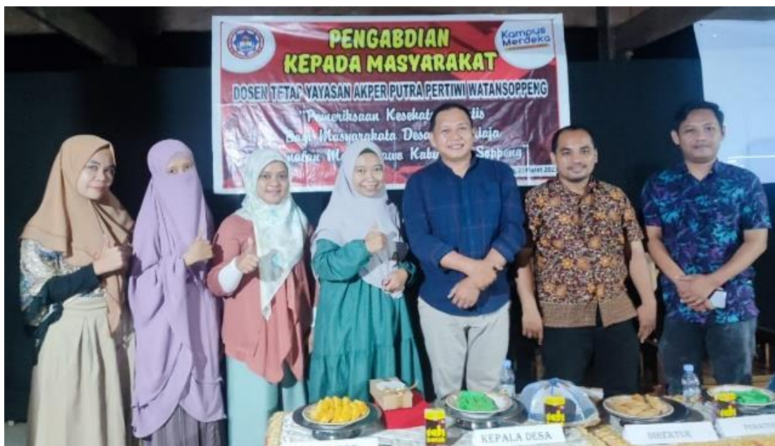
Gambar 2. Bersama Kepala Desa yang Membantu Kegiatan Penyuluhan

Adapun faktor yang menghambat kelancaran kegiatan yaitu pada saat pemeriksaan kesehatan gratis di desa marioriaja musim panen jagung sehingga masih kurang masyarakat yang datang .Sedangkan faktor pendukung adalah adanya tim pengabdian dan mitra yang kompak,bisa bekerjasama dengan baik, adanya kebersamaan yang saling membutuhkan