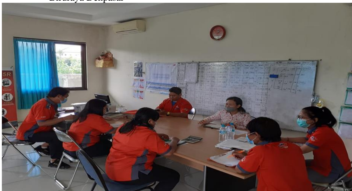
Gambar 3.1. Persiapan Pelatihan dan Pemberian Materi Karyawan PT. Atlantic Biruraya Denpasar

Pada tanggal 27 Agustus 2021 sebagai hari kedua pelatihan, dimana pada tanggal tersebut dilakukan pelaksanaan praktek kegiatan kerja cara pengambilan data menjadi informasi yang bermanfaat serta cara pengawasannya. Selain kegiatan praktek