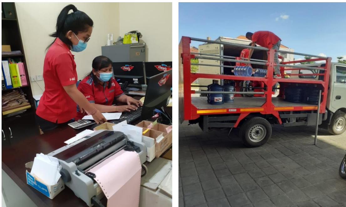
Gambar 3.3. Input Data dan Pengawasan Pengeluaran Barang