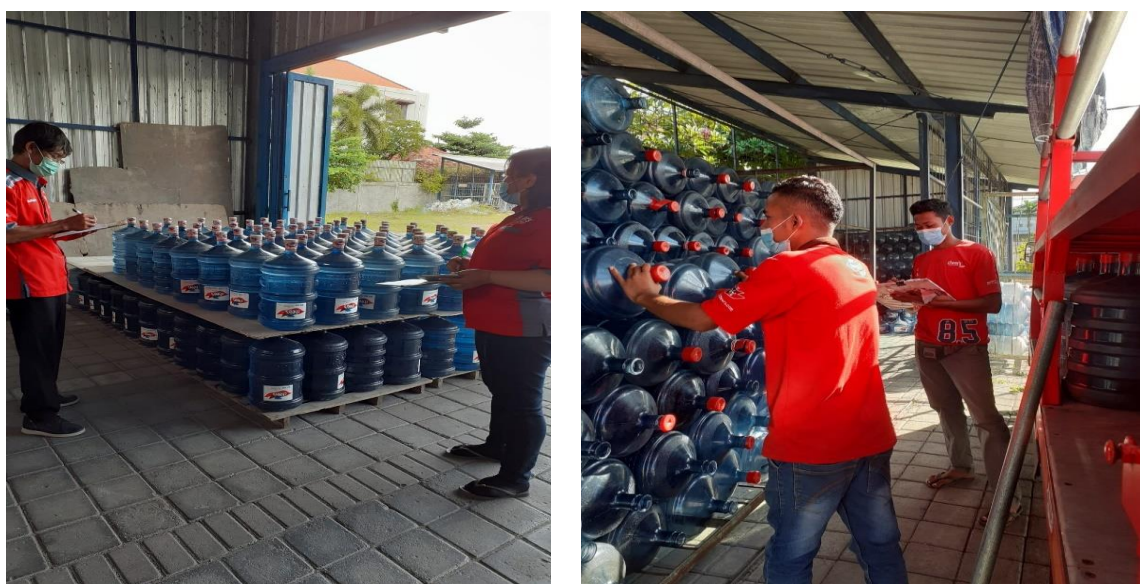
Gambar 3.2 Perhitungan Data dan Pengawasan Atas Penerimaan Barang Jadi dan Material Produksi

Setelah dilakukan pengecekan data tersebut, berikutnya dilakukan penginputan data oleh bagian admin. Bagian admin memastikan kembali data yang diinputkan dengan fisik barang yang ada dengan benar. Hal ini perlu juga melakukan koordinasi dengan bagian penerimaan agar dapat melakukan pengolahan data secara tepat. Atas data yang ada, bagian admin melakukan pencetakan faktur penjualan yang diberikan ke bagian gudang untuk dilakukan pengeluaran barang. Pada bagian gudang selain melakukan pemeriksaan atas faktur atau dokumen yang diterima juga sangat penting untuk melakukan pengawasan atas barang yang dikeluarkan agar tidak terjadi kesalahan yang berakibat kehilangan dan kerugian perusahaan. Adapun dokumentasi atas kegiatan tersebut dapat dilihat pada gambar 3 sampai 4.