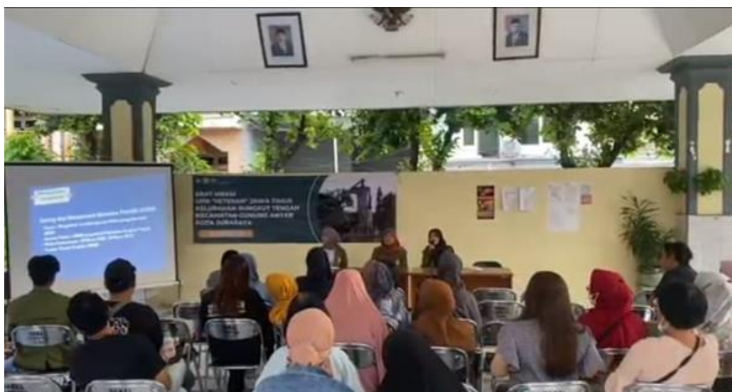
Gambar 1. Sosialisasi Pemanfaatan E-Commerce