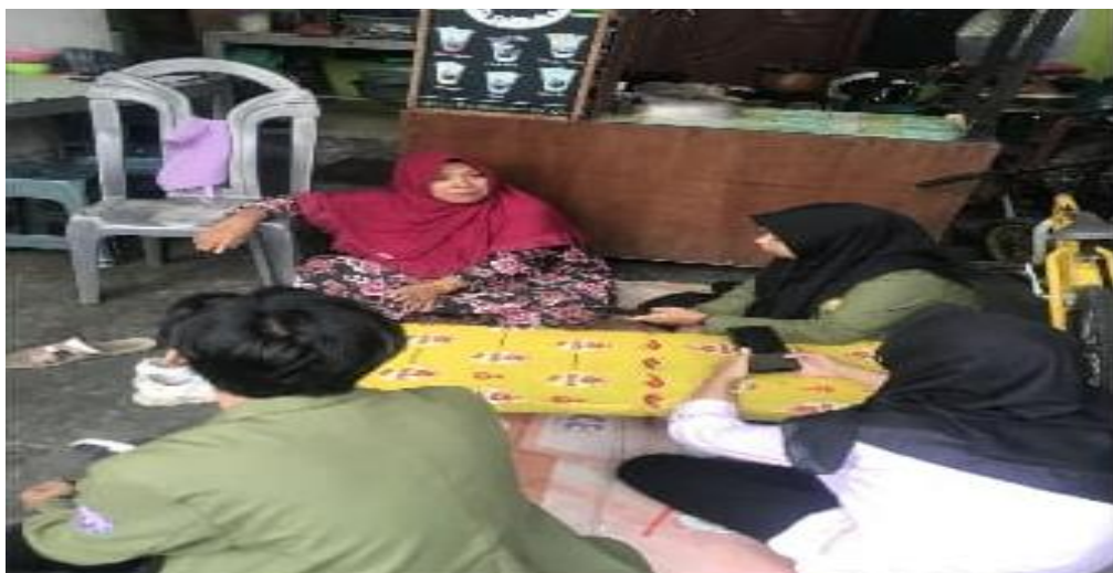
Gambar 2. Pendampingan dan Konsultasi