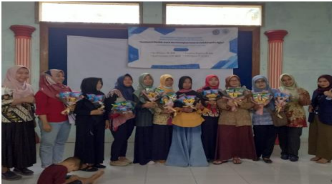
Gambar 3.3. Ibu –Ibu PKK Desa Ngadirejo Karanganyar