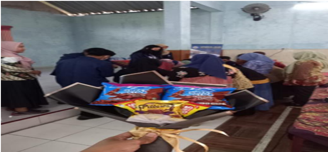
Gambar 3.2. Hasil Pelatihan Buket Snack

Acara selanjutnya dilakukan pelatihan strategi pemasaran memberikan penjelasan mengenai siapa yang menjadi target pasar dalam usaha bucket snack ini yaitu kepada para remaja, dan dewasa. Pada usia tersebut mereka lebih sering membutuhkan produk ini untuk dijadikan sebagai hadiah terhadap orang-orang tersayang. Juga menjelaskan mengenai harga jual bucket snack, cara memasarkan bucket snack yakni melalui media sosial dan juga bisa secara offline dengan mengikuti pameran-pameran, kegiatan-kegiatan maupun dijual ditoko, tujuan diadakannya pelatihan strategi pemasaran agar ibu PKK dapat lebih memahami mengenai bagaimana cara menentukan siapa yang menjadi target pasar, berapa harga jual, dan bagaimana cara memasarkan bucket snack agar dapat dijangkau oleh para konsumen.