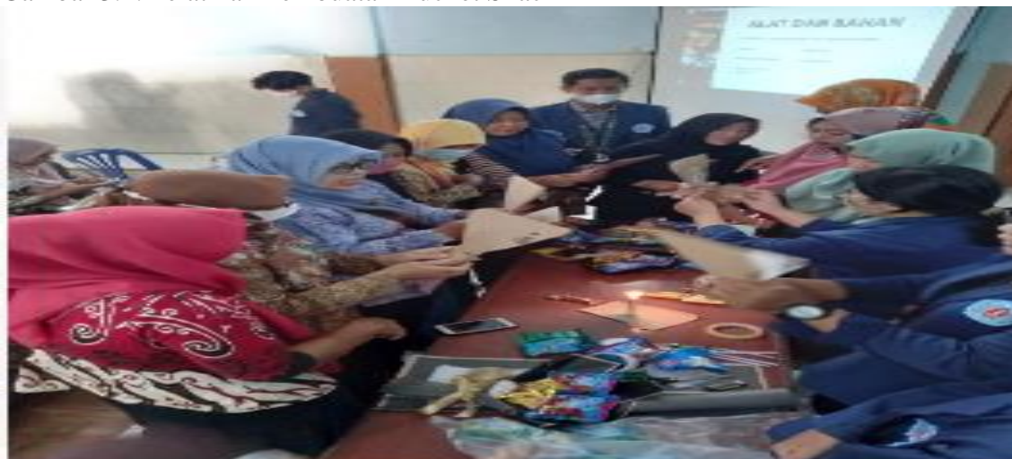
Gambar 3.1. Pelatihan Pembuatan Bucket Snack

Dalam pelaksanaan pelatihan pembuatan bucket snack dan strategi pemasaran dilakukan pada ibu-ibu PKK desa Ngadirejo yang bertempat di kantor balai desa Ngadirejo Kabupaten Karanganyar yang dilaksanakan pada tanggal 26 September 2022 yang dihadiri sebanyak 30 orang ibu-ibu PKK. Dalam kegiatan tersebut diberikan pelatihan pembuatan bucket snack oleh pengusul yang telah memiliki bisnis bucket snack mulai dari proses, merangkai snack sampai pada proses penghiasan bucket snack dengan kain spunbond dan pita.