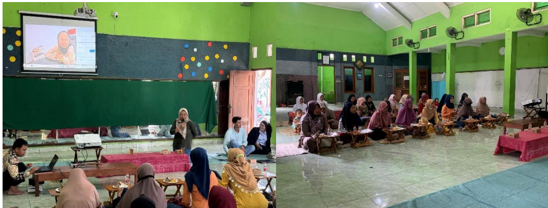
Gambar 2. Foto Kegiatan bersama Peserta

Kemudian pelaksanaan PKM bersama komunitas Rumah Baca ini menjadi langkah penting untuk membangun ruang belajar bersama bagi orang tua, terutama dalam isu yang dekat dengan kehidupan sehari-hari seperti penggunaan gawai dan konsumsi media anak. Selain itu, kegiatan ini juga menjadi upaya menjembatani kesenjangan literasi digital keluarga melalui kolaborasi antara FISIP UPN “Veteran” Jakarta, Rumah Baca Raden Mas Suryowinoto, dan Ruang Binari. Dengan melibatkan komunitas, edukasi literasi digital tidak hanya berlangsung sebagai penyampaian materi satu arah, tetapi juga menjadi ruang refleksi terhadap pengalaman pengasuhan yang dialami peserta secara langsung.