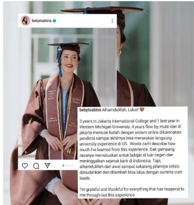
Fotor Wisuda

Dalam era digital dan media sosial, terutama di kalangan generasi milenial dan Gen Z, penggunaan bahasa asing atau campuran bahasa dalam unggahan atau komentar cukup umum. Hal ini dapat disebabkan oleh beberapa faktor, seperti pengaruh budaya populer global, eksposur yang lebih besar terhadap konten berbahasa asing, dan persepsi bahwa penggunaan bahasa asing terlihat lebih "gaul" atau "tren". Namun, penting untuk diingat bahwa bahasa memiliki peran penting dalam identitas budaya dan komunikasi antarindividu. Penggunaan bahasa asing atau campuran bahasa dalam konteks informal seperti media sosial dapat memperkaya ekspresi dan kreativitas bahasa, tetapi juga harus tetap memperhatikan pentingnya mempertahankan dan mempromosikan bahasa Indonesia sebagai bahasa nasional.