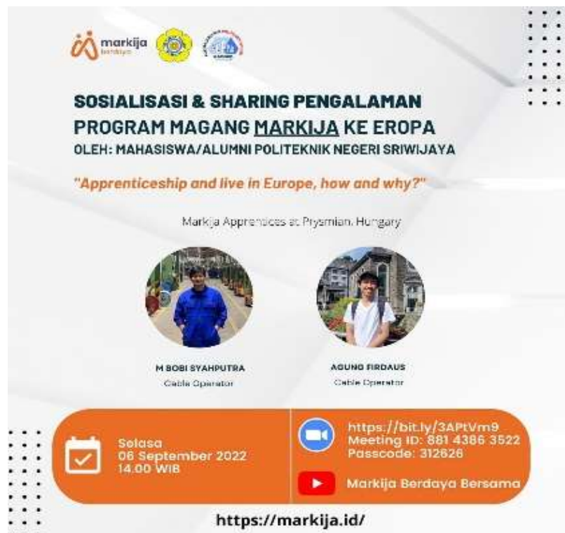
Famplet Sosialisasi

lisan melainkan juga melalui informasi tulisan. Pemerintah Indonesia memasukkan bahasa Inggris ke dalam bahasa asing pertama yang dipergunakan di Indonesia. Bahasa Inggris dimasukkan ke dalam kurikulum dan merupakan mata pelajaran yang penting di SD, SLTP, dan SLTA hingga berpeluang besar dijadikan sebagai bahasa pengantar pendidikan di beberapa sekolah yang ada di Indonesia Seperti famlet informasi berikut :