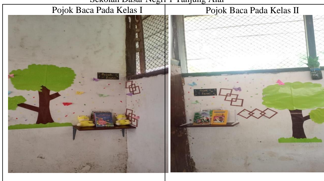
Gambar 3.2. Pojok Baca Yang Dibuat Pada Masing-Masing Kelas di Sekolah Dasar Negeri 1 Tanjung Alai