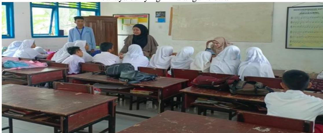
Gambar 3.1. Sosialisasi budaya literasi dan intelektualitas tentang bahaya bullying Dikalangan siswa

Manfaat yang bisa didapatkan dari sosialisasi ini agar siswa dapat saling menghargai satu sama lain dan terhindar dari prilaku bullying. Serta edukasi secara nyata tentang bahaya bullying yang dapat merusak ketenangan belajar siswa. Melalui literasi siswa diberikan banyak kesempatan untuk menggali dan mencari lebih banyak informasi tentang permasalahan bulliying yang terjadi baik dari dalam sekolah dan diluar sekolah. Membaca buku, menulis catatan, atau membuat cerita adalah beberapa kegiatan positive yang dapat membantu anak-anak mengembangkan kemampuan