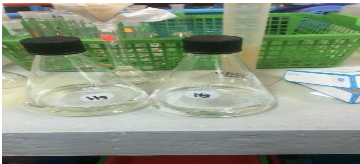
Gambar 3.3 Sampel