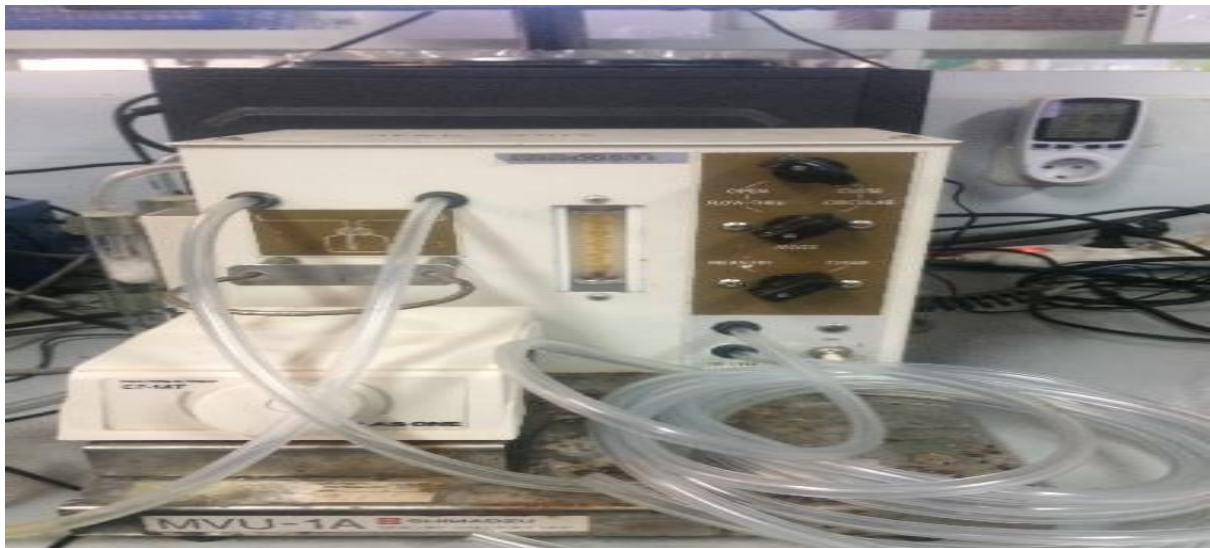
Gambar 3.2 Instrument SSA