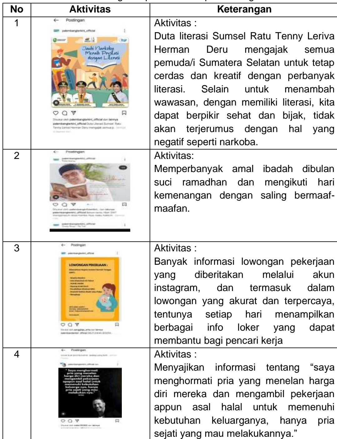
Tabel 1 Bentuk aktivitas warganet pada akun @palembangterkini.official

khususnya di wilayah Palembang dan sekitarnya. Tujuan dari akun ini dibuat tentunya untuk memenuhi kebutuhan informasi tentang kejadian apa saja yang terjadi di kota Palembang dan sekitarnya. Adapun bentuk dan aktivitas warganet yang dapat digambarkan dari hasil caption melalui akun instagram @palembangterkini.official yang dapat dilihat pada tabel dibawah ini: