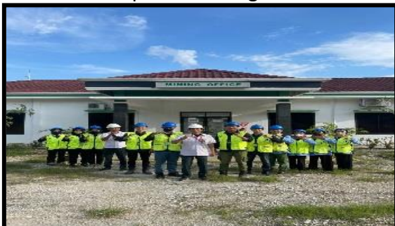
Dokumentasi pada saat Kegiatan Penelitian